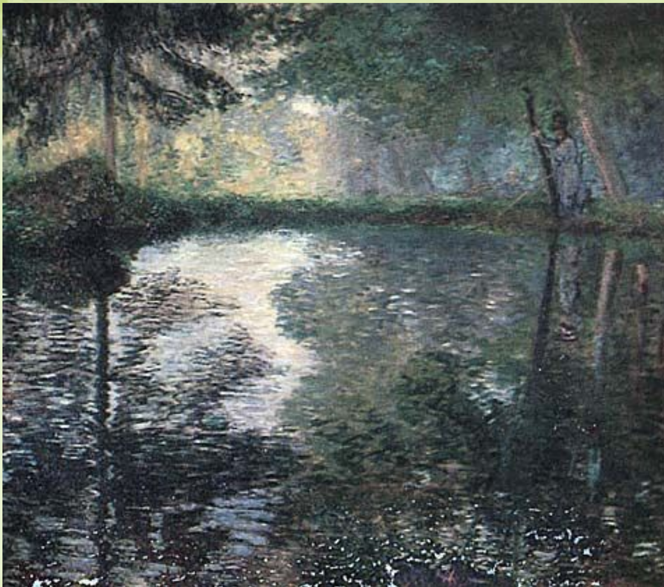
Клод Моне. «Пруд в Монжероне»