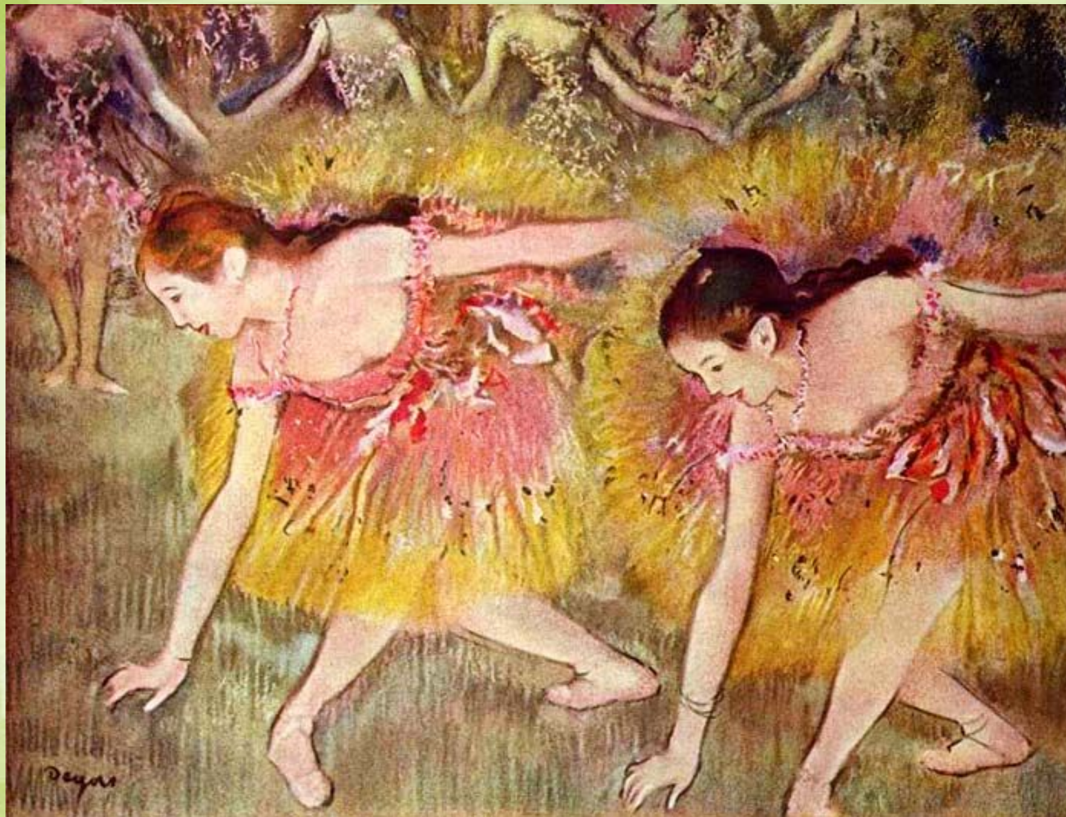
Эдгар Дега. Танцовщицы на поклонях