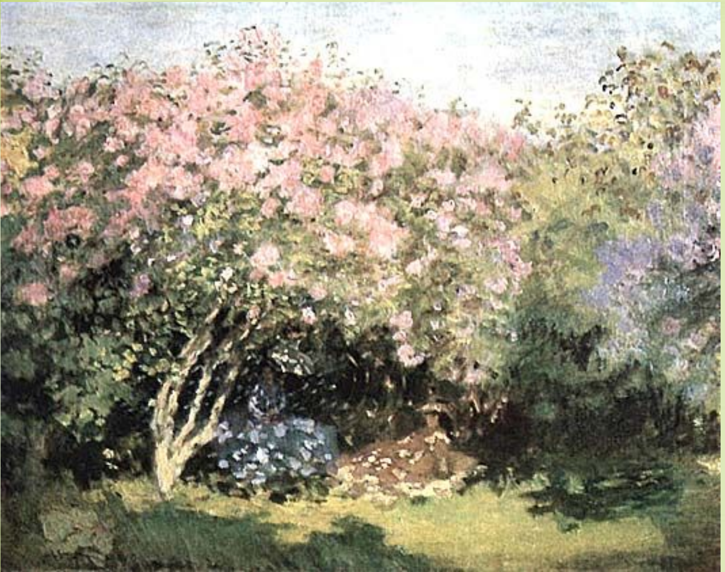
Клод Моне. «Сирень на солнце»