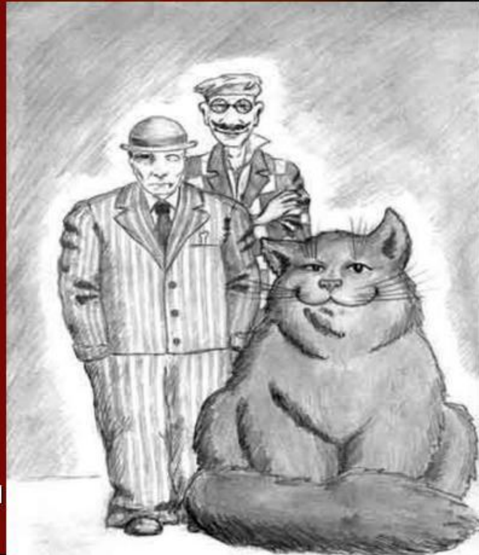
Азazelло, Коровьев и Бегемот. Бумага, карандаш. 30x21. 2004.

Имя Азazelло образовано Булгаковым от ветхозаветного имени Азazel. Так зовут отрицательного героя ветхозаветной книги, падшего ангела, который научил людей изготавливать оружие и украшения. Вероятно, Булгакова привлекло сочетание в одном персонаже способности к обольщению и к убийству.