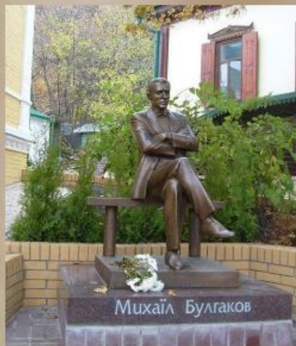
Открытый в октябре 2007 года памятник Булгакову возле его дома-музея в Киеве