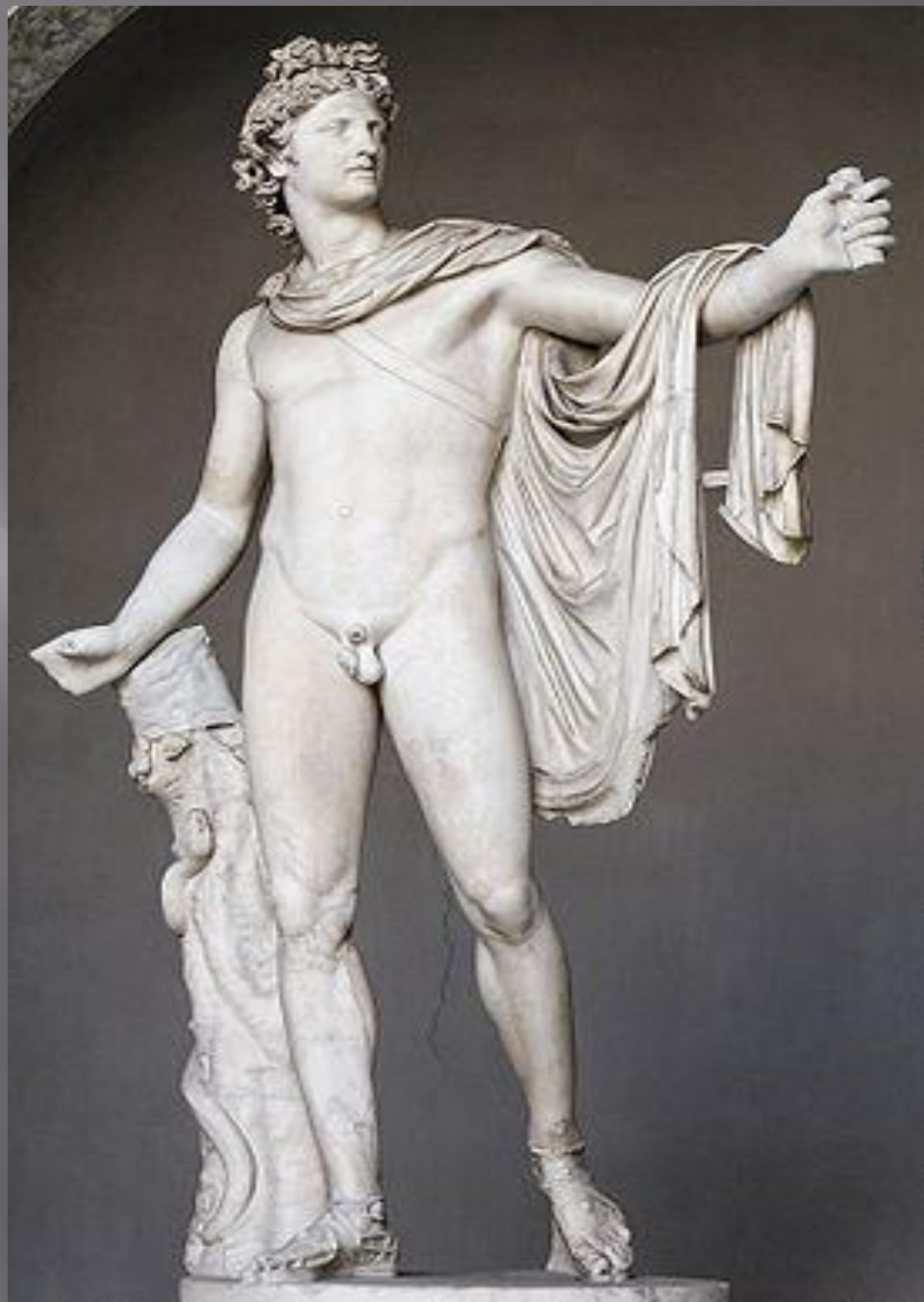
Аполлон Бельведерский. Леонардо