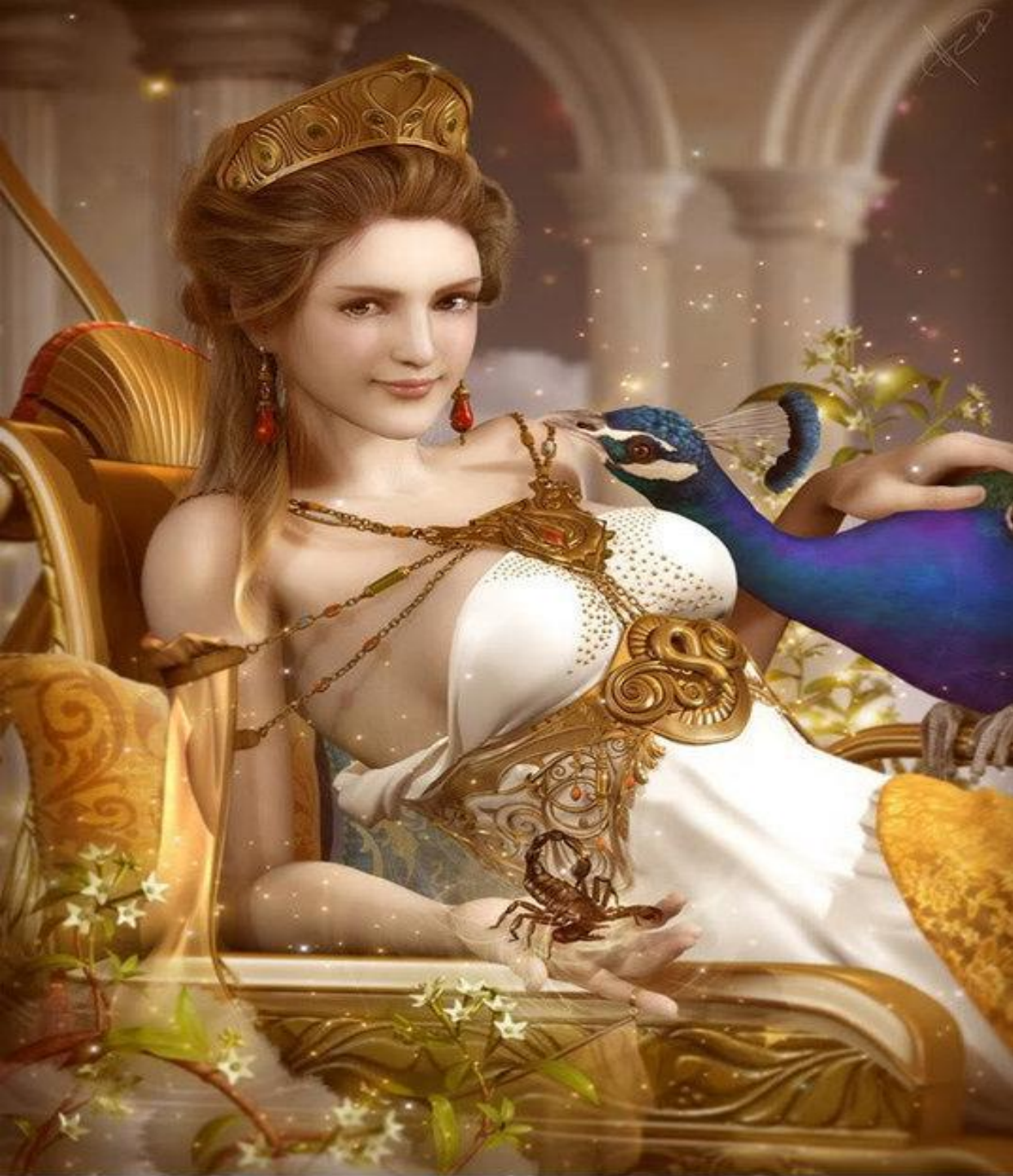
Гера, супруга Зевса