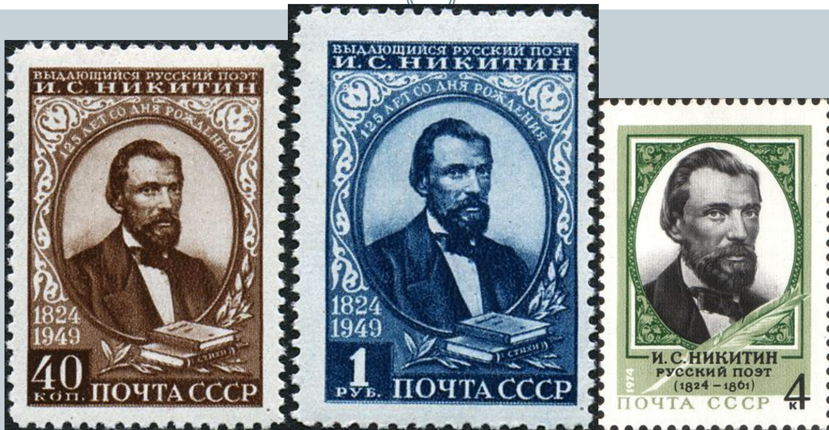
Марки «И.С.Никитин» 1949 год