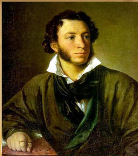
А. С. Пушкин (1799-1837).

Зима!.. Крестьянин, торжествуя, На дровнях обновляет путь; Его лошадка, снег почуя, Плетётся рысью как-нибудь,