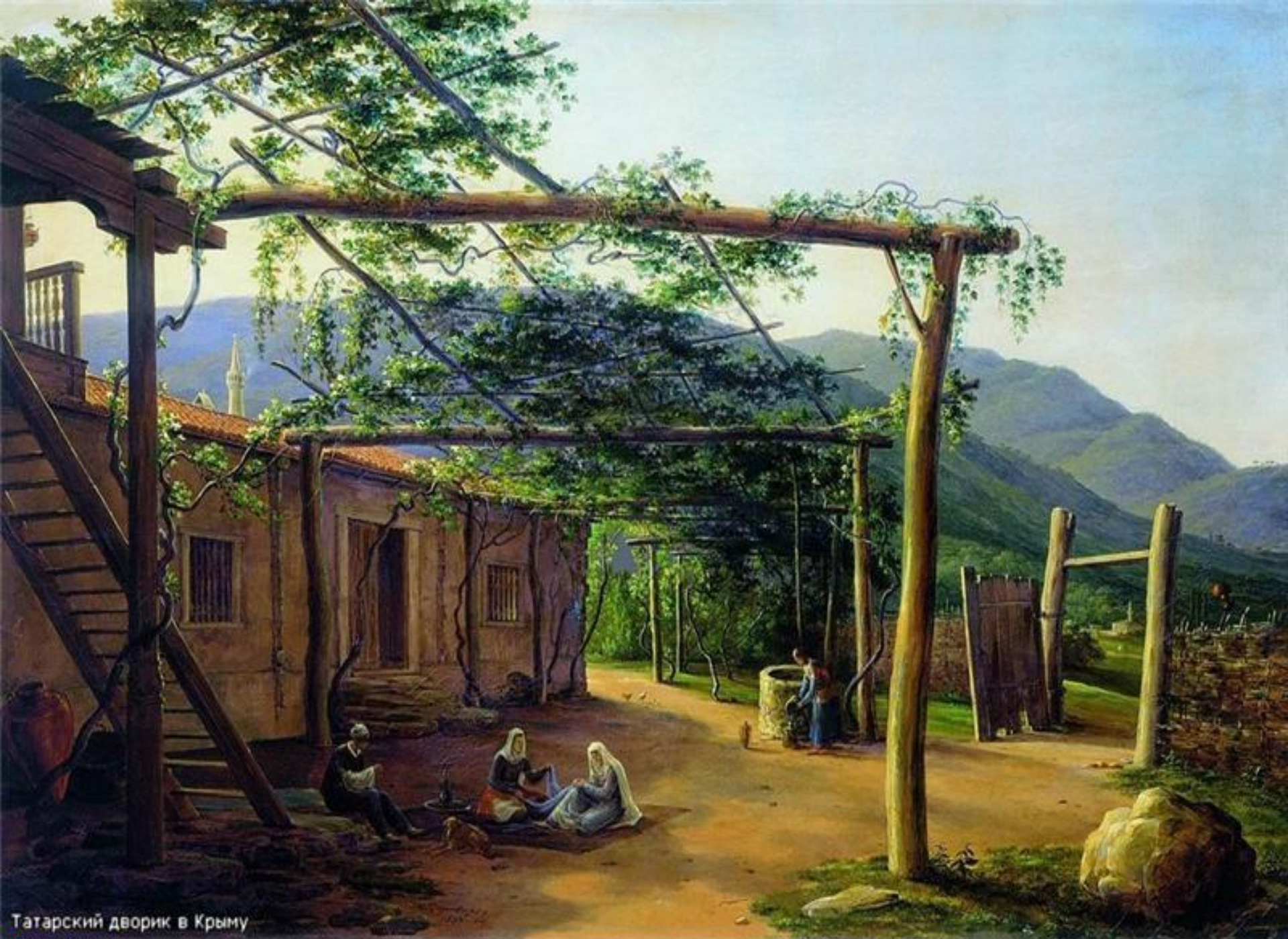
Татарский дворик в Крыму