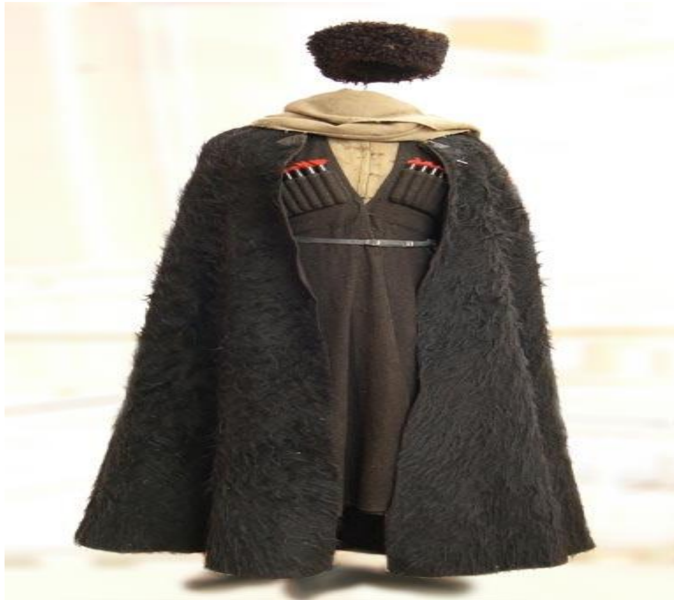
Бешмет - стёганый полукафтан