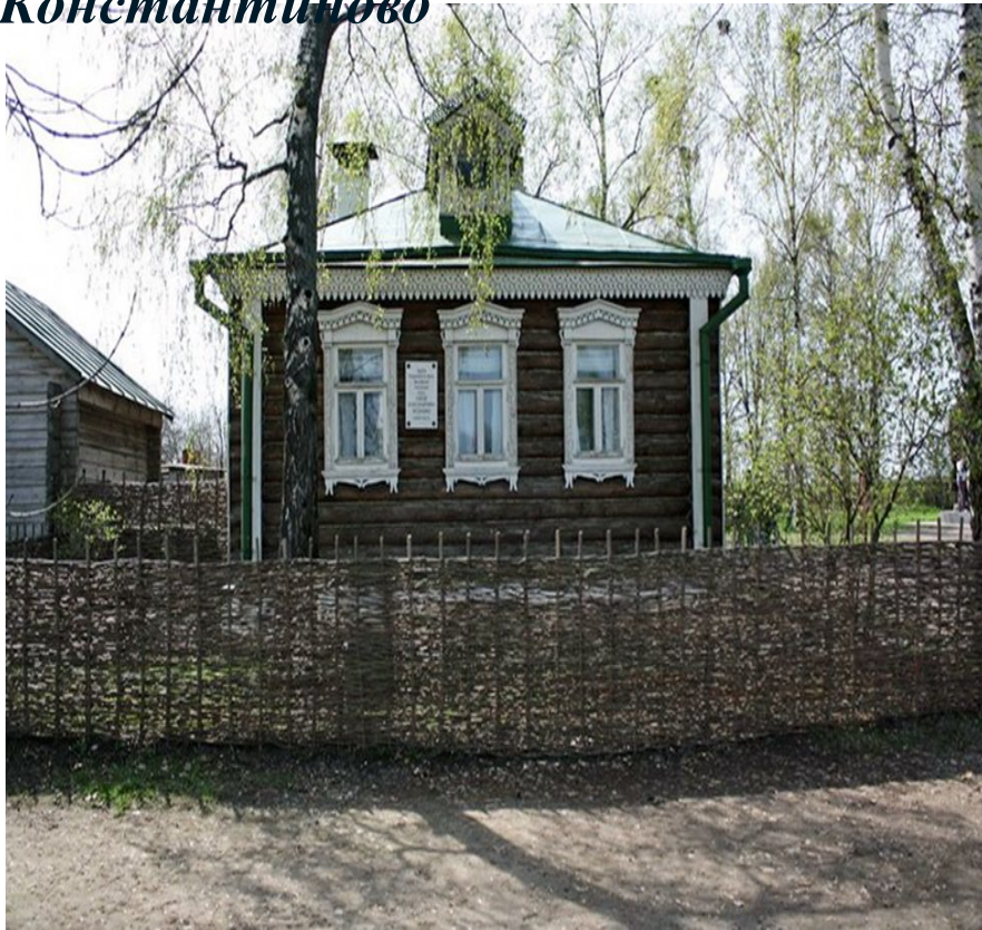
Дом С. Есенина в Константиново