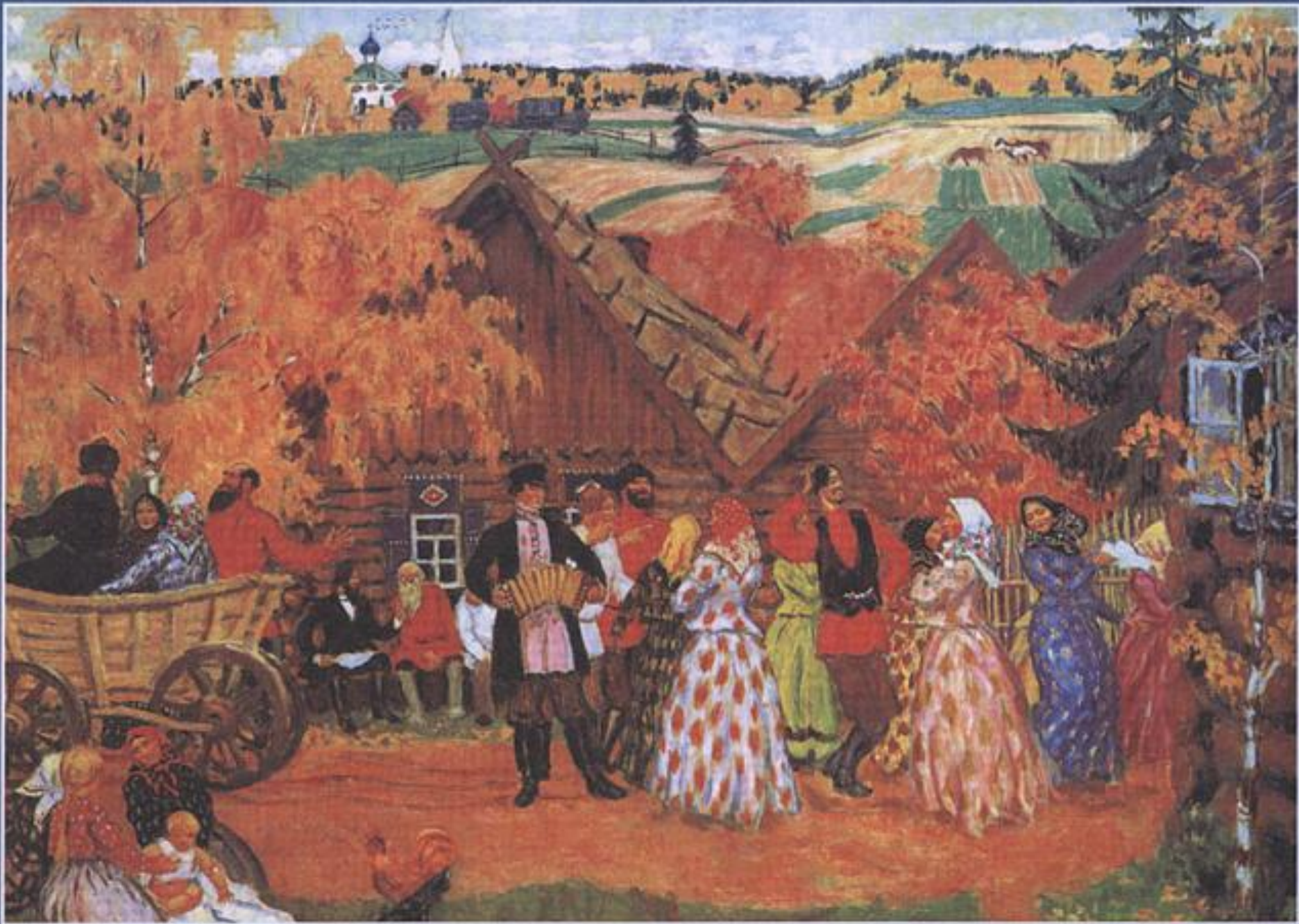
Б. КУСТОДИЕВ. Осенний сельский праздник