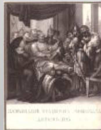
«Поучение» Владимира Мономаха