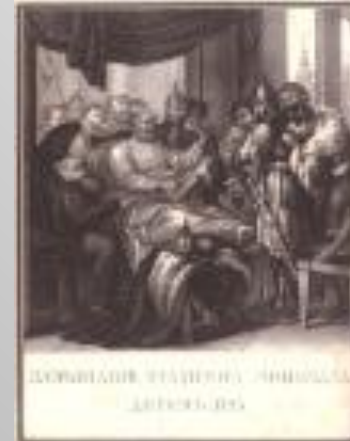
«Поучение» Владимира Мономаха