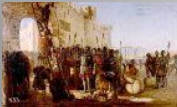
Князь Олег прибывает щит на вратах Царьграда