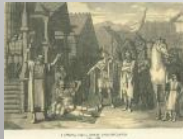
Смерть князя Олега