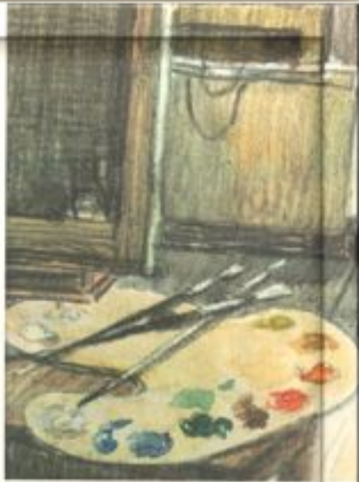
Т. В. Спирова-Тихонова «Первые зрители» Фрагмент картины