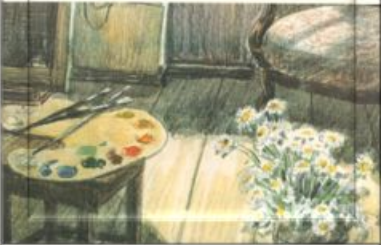
Т. В. Спирова-Тихонова «Первые зрители» Фрагмент картины