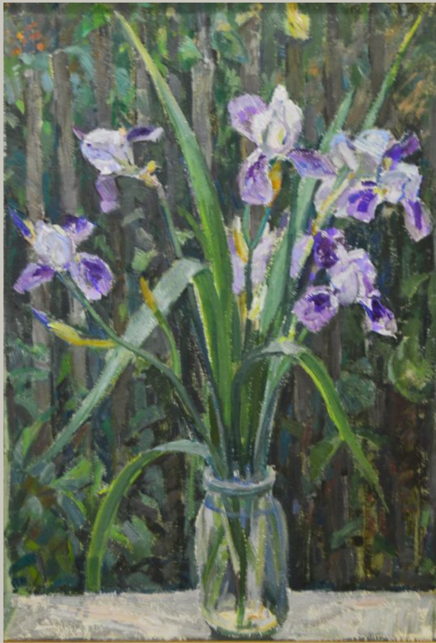
«Ирисы» Строганов Т.В.