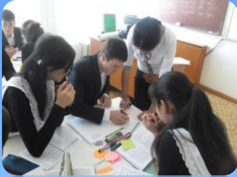
Работа в группе