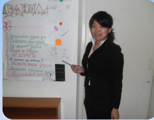
Защита своих рисунков