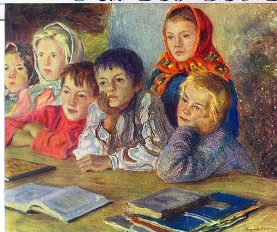
Н.П.Богданов-Бельский «Дети на уроке»