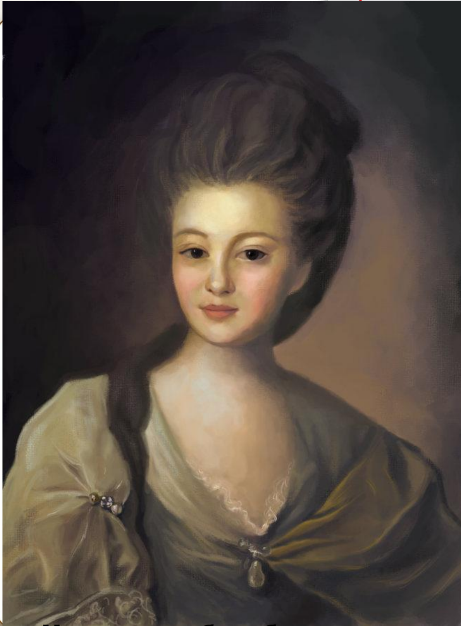
Ф.С.Рокотов «Портрет Струйской»