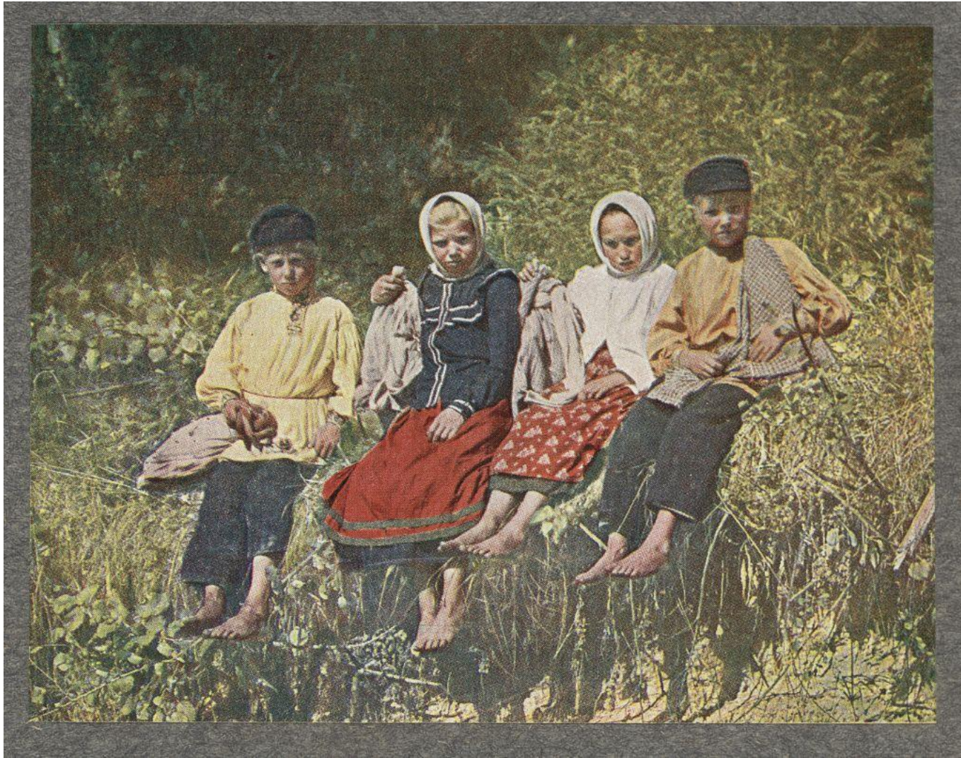
Макеевская общеобразовательная школа I-III ступеней № 53