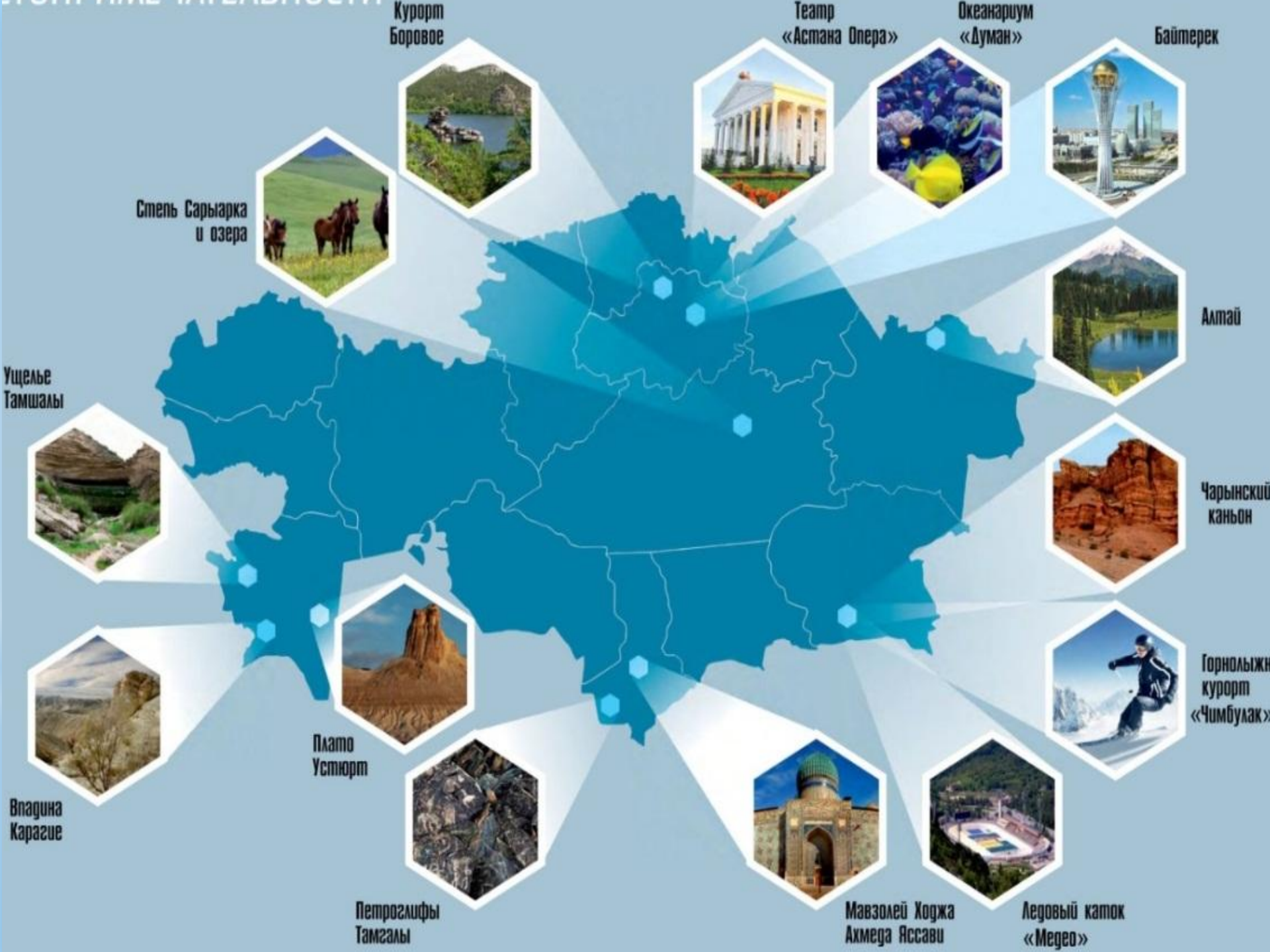
Стень Сарыарка и озера