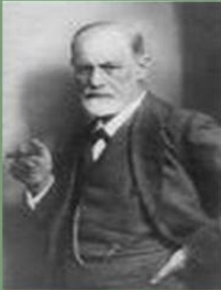
Афанасий Неофитович Шеншин

Несмотря на эти обстоятельства и даже на наличие у Шарлотты дочери от Фета, завязывается бурный роман. Чувства влюбленных были настолько сильны, что Шарлотта решается на побег вместе с Шеншиным в Россию. Осенью 1820 года Шарлотта, бросив мужа и дочку, уезжает из Германии.