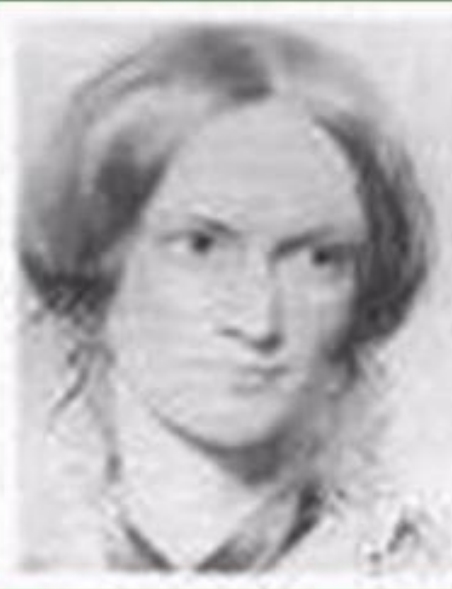
Каролина Шарлотта Фет