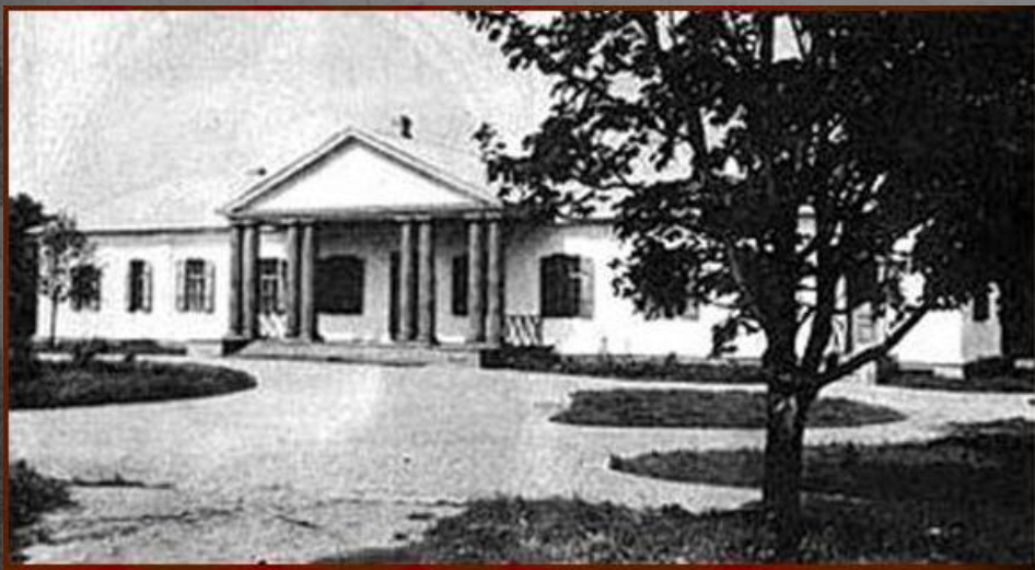
Родительский дом в Васильевке