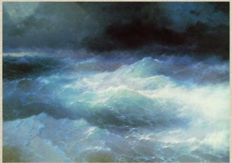
И.К. Айвазовский. Среди волн.

Картина «Среди волн» была написана в 1898 г., когда И.К. Айвазовскому было уже 80 лет. Картина была написана за 10 дней. Эта самая большая работа художника по размеру. Размер этой картины 12 квадратных метров.