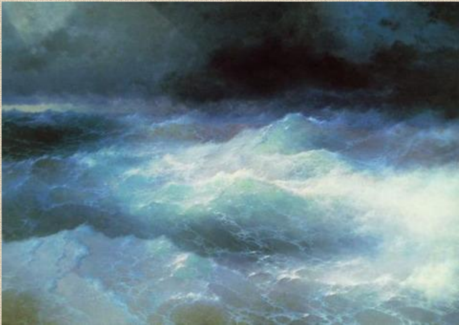
И.К. Айвазовский . Среди волн.