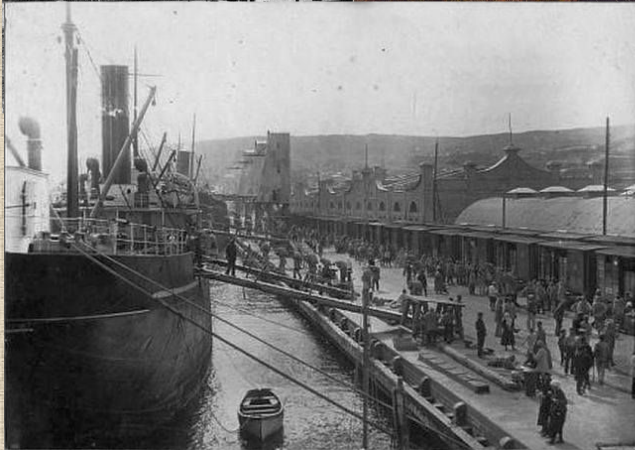
гъ. Южная набережная.