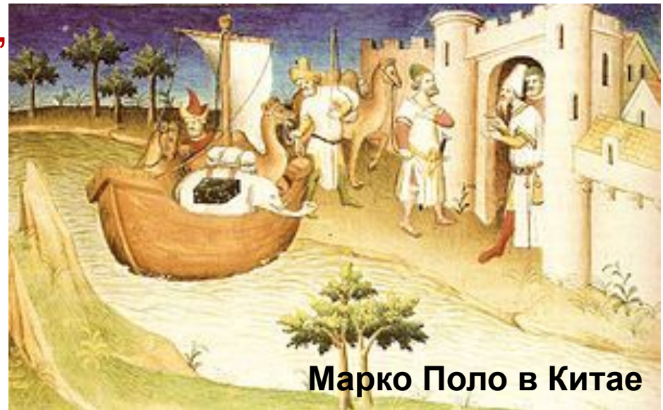
Марко Поло в Китае

Риме. Словечко «миллионе» , которым отважный путешественник называл тысячу тысяч , прочно пристало к Марко Поло. Современники прозвали его Марко Миллионе.