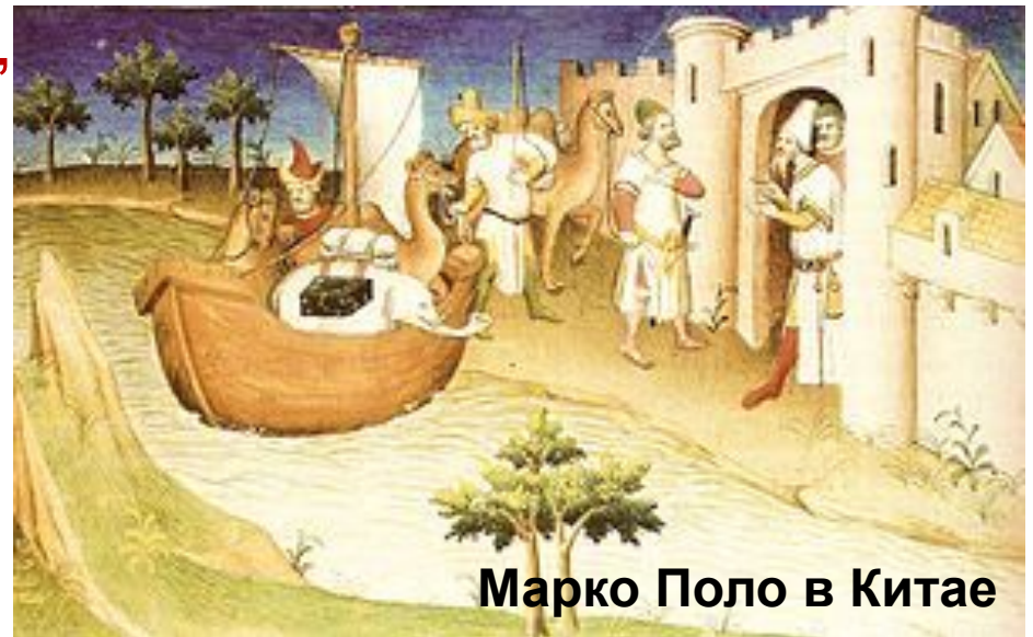
Марко Поло в Китае

Риме. Словечко «миллионе» , которым отважный путешественник называл тысячу тысяч , прочно пристало к Марко Поло. Современники прозвали его Марко Миллионе.