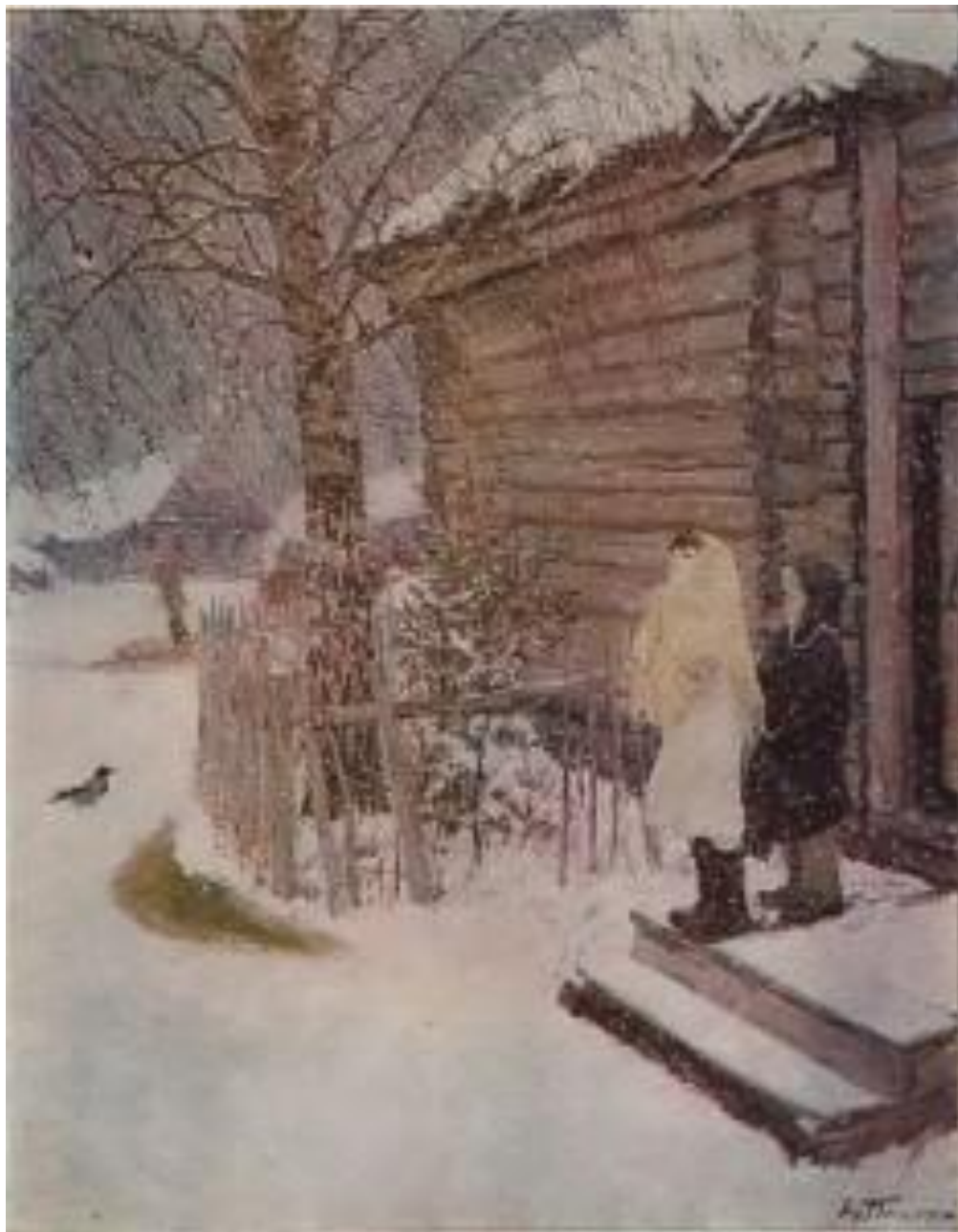
Аркадий Алексеевич Пластов «Первый снег», 1946 г.