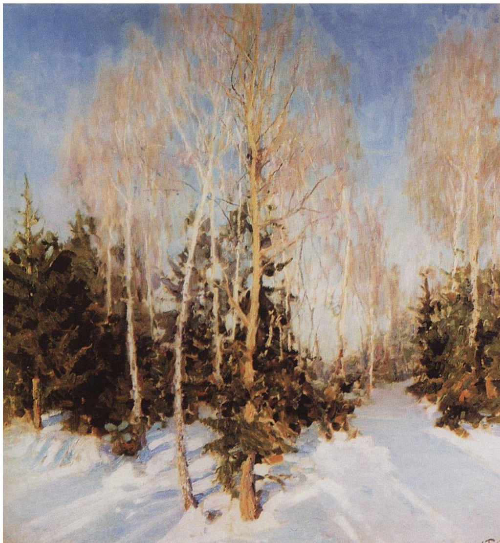
Игорь Эммануилович Грабарь «Зимний пейзаж», 1954 г.