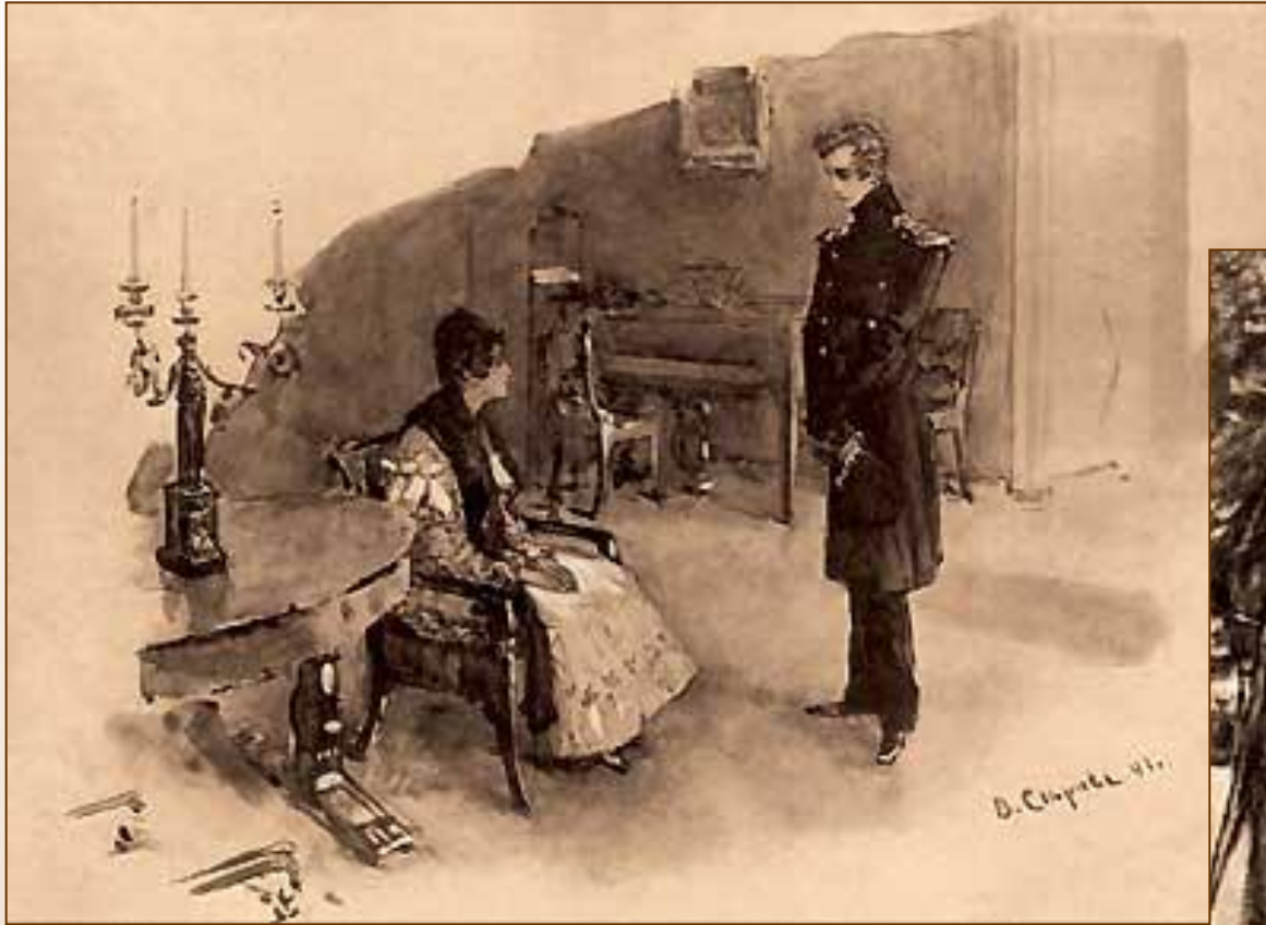
Объяснение Печорина с Мери