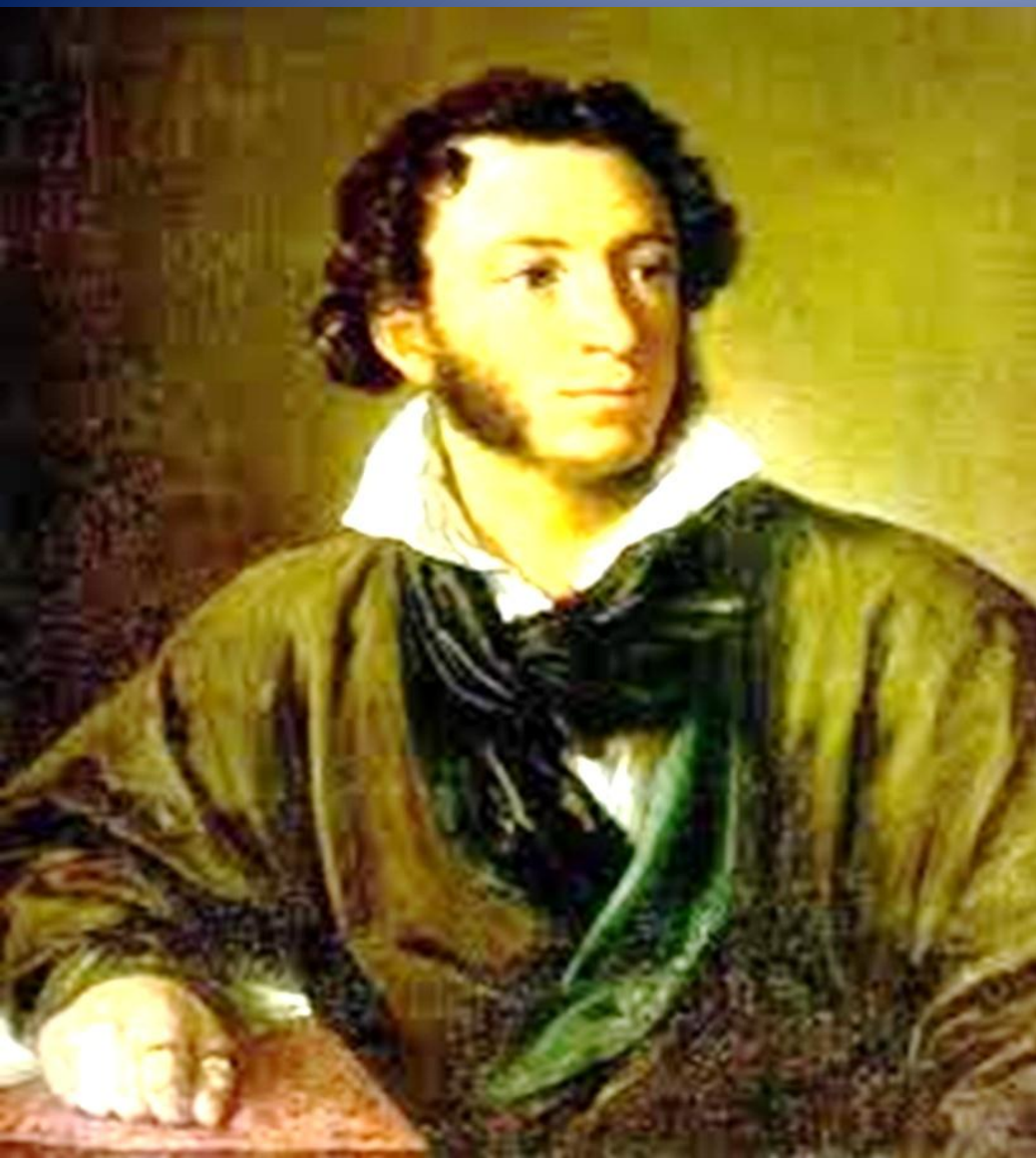
Александр Сергеевич Пушкин (1799 – 1837г.г.)