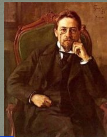
5 Чехов А.