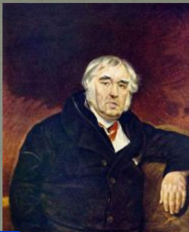
2 Крылов И.