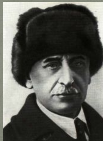
1 Житков Б.