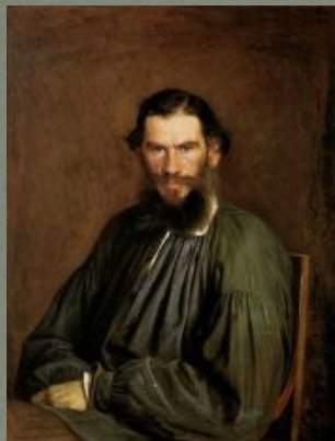
4 Толстой Л.