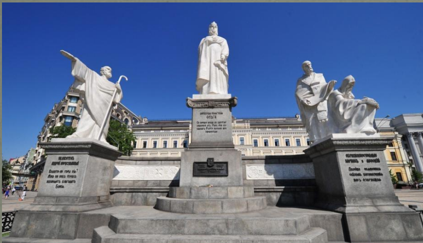
Памятник на Украине