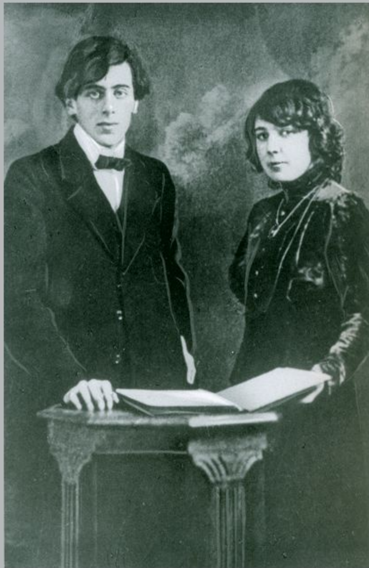
Марина Цветаева и Сергей Эфрон. 1912 год.