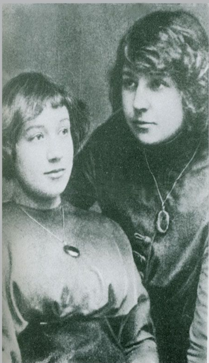
Анастасия и Марина Цветаевы. 1911.