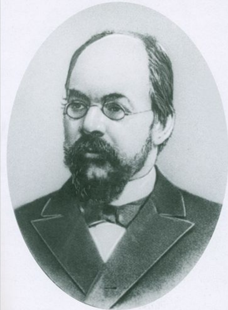
Иван Владимирович Цветаев. 1903.

Отец – Иван Владимирович Цветаев (1847 – 1913)