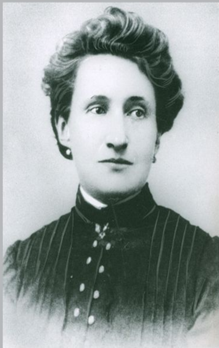
Мария Александровна Цветаева, урожденная - Мейн. 1903 г.