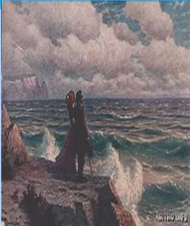
Пушкин и Раевская на южном берегу Крыма.

5 августа Отъезд из Пятигорска. Пушкин с семьёй Раевских отправился в Крым.