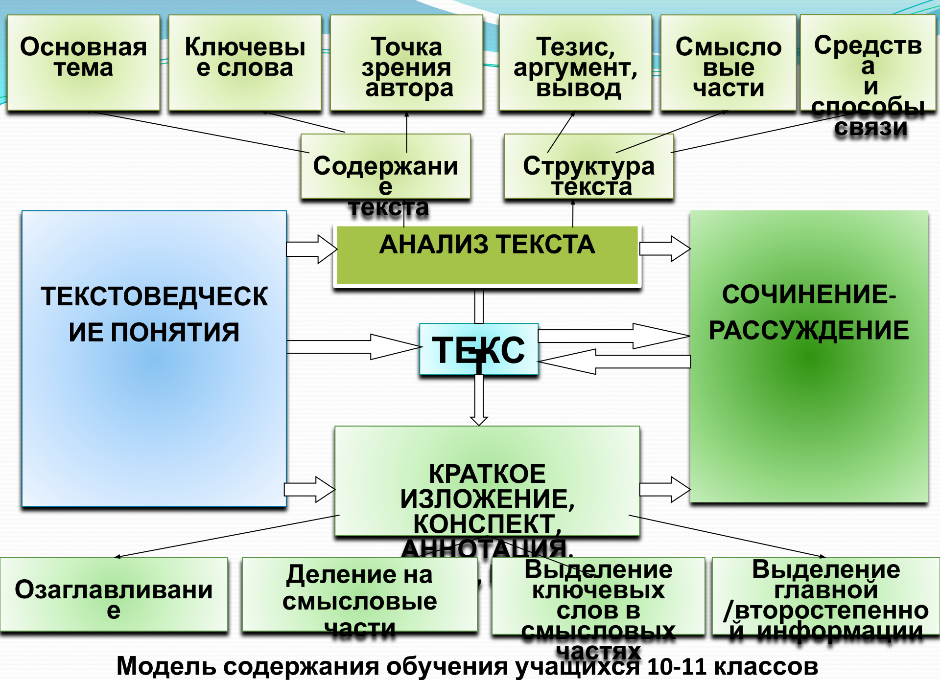
Модель содержания обучения учащихся 10-11 классов