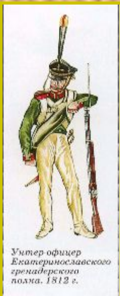
Унтер-офицер Екатеринославского гренадерского полка. 1812 г.

Кавалерия включала лёгкую ( гусары и уланы, вооружённые саблями и пиками), среднюю ( драгуны ) и тяжёлую (кирасиры, вооружённые палашами).