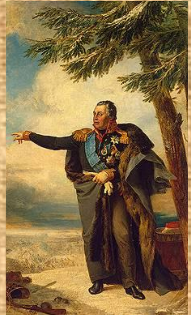
М.И. Кутузов на Бородинском сражении