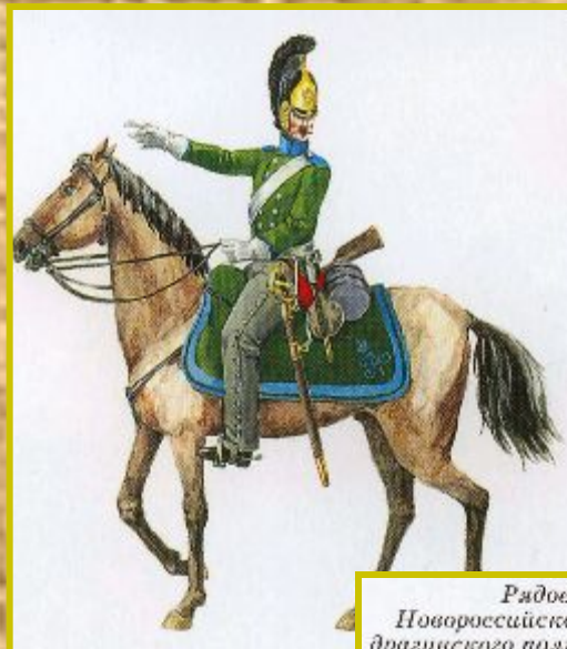
Рядовой Новоросийского драгунского полка. 1812-1814 гг.