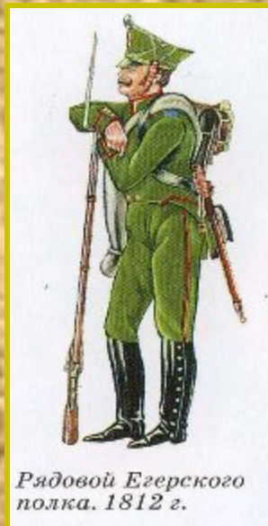
Рядовой Егерского полка. 1812 г.