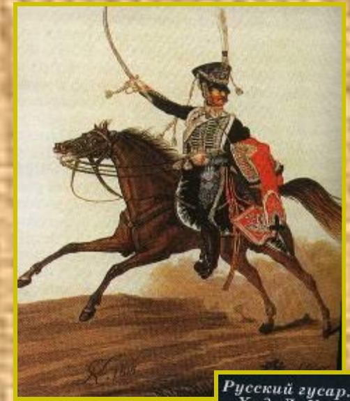
Русский гусар. Худ. Л. Киль 1815 г.