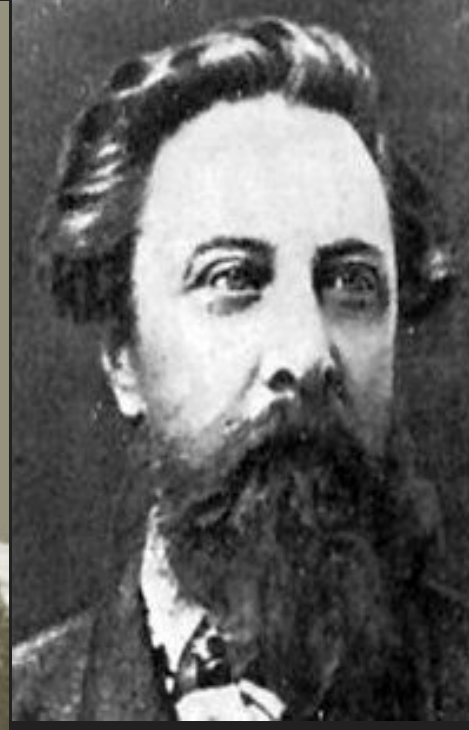
Алексей Константинович Толстой