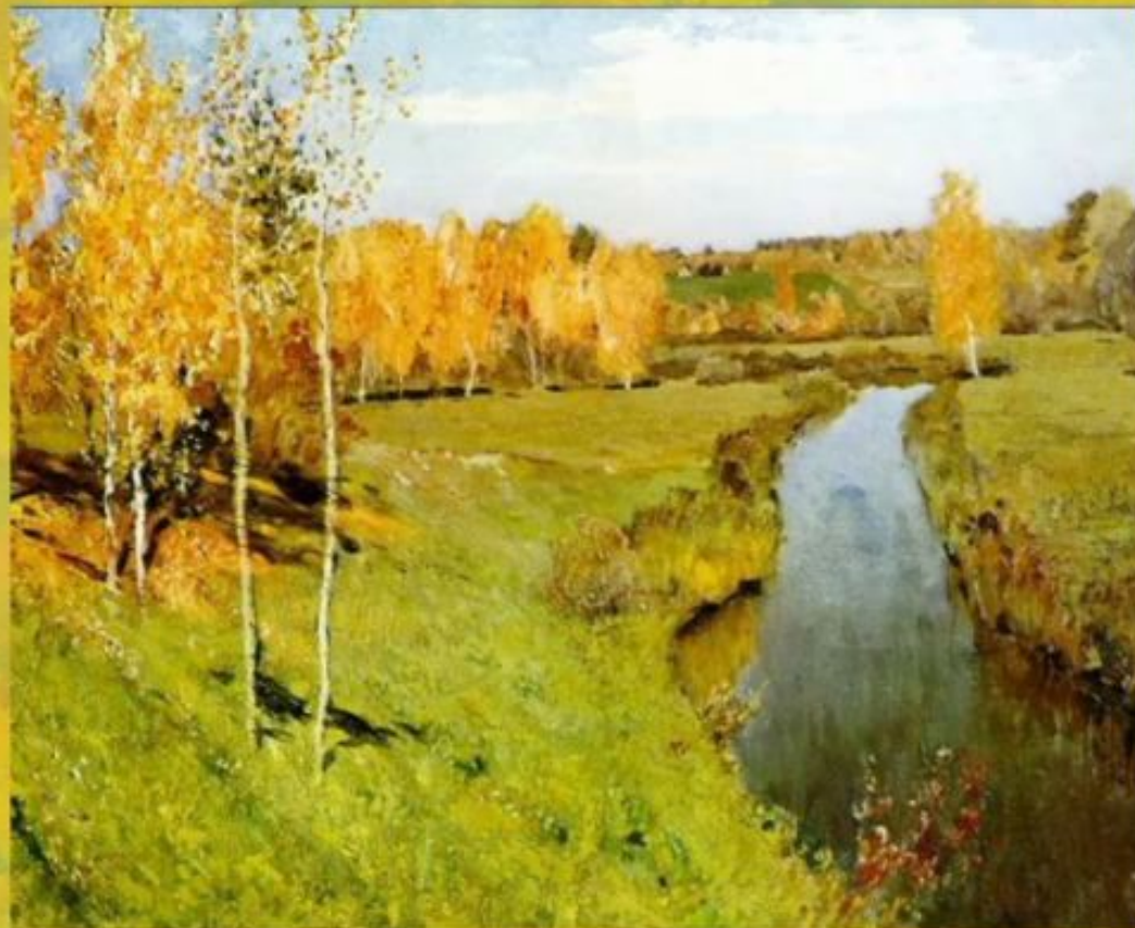
И.И. Левитан. Золотая осень