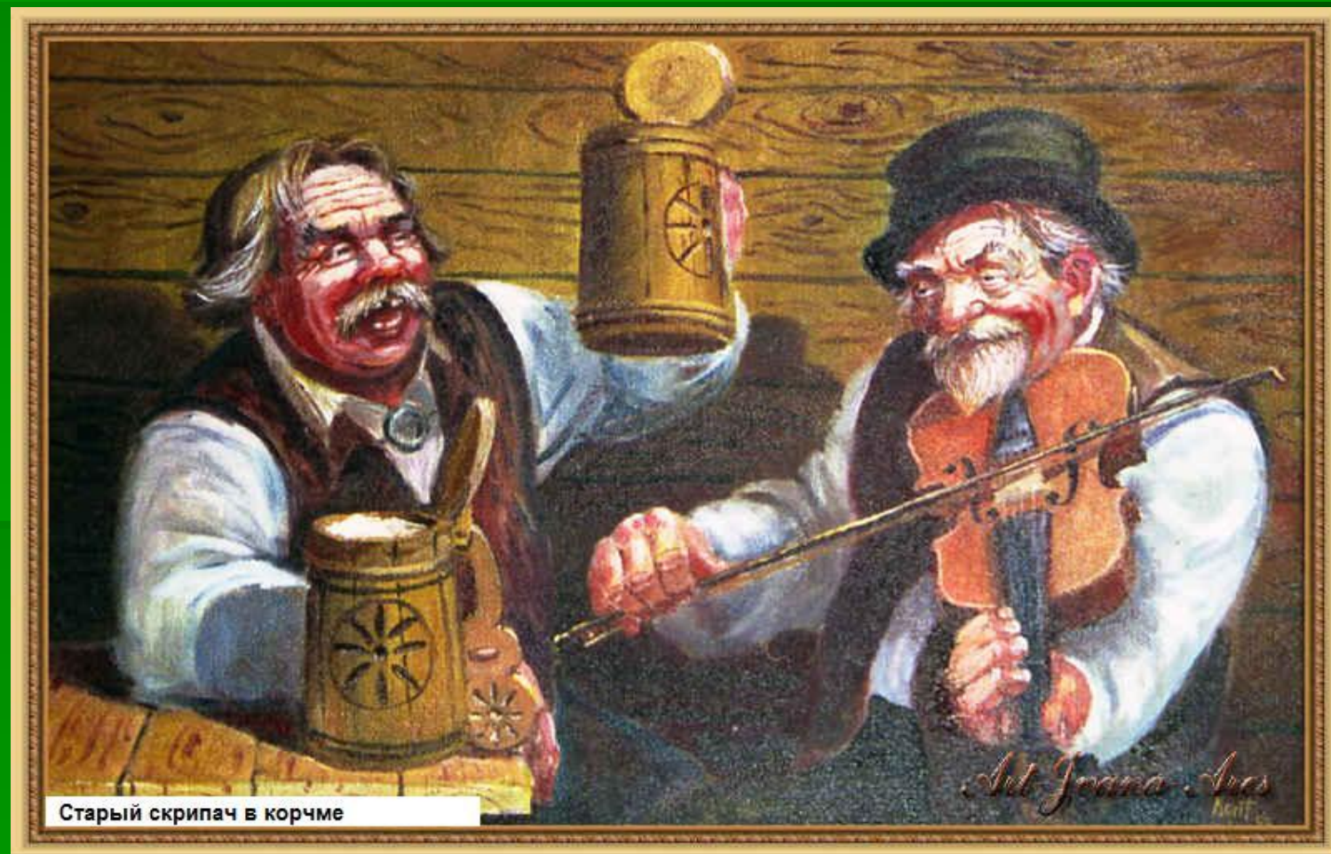
Старый скрипач в корчме