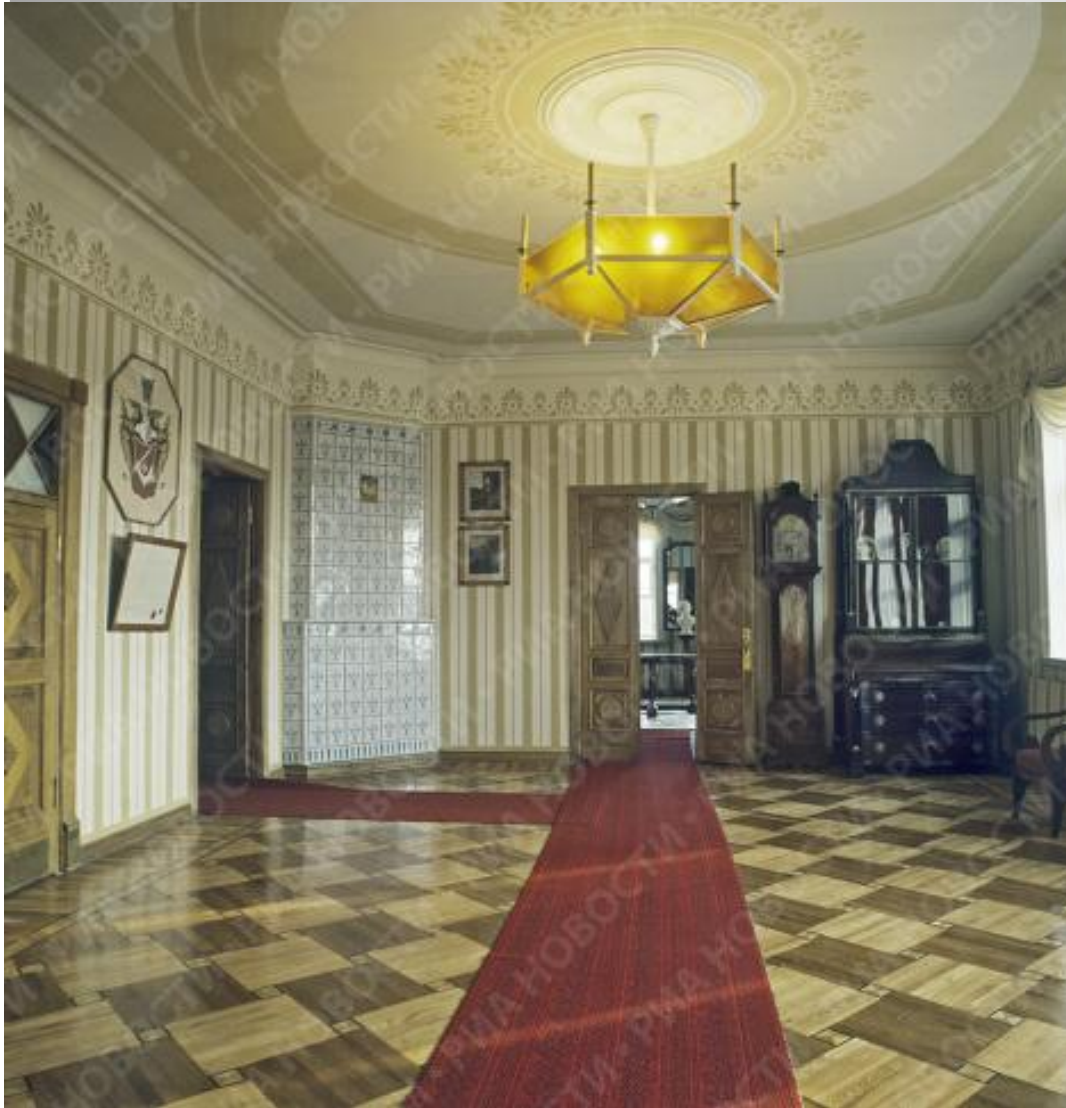
Столовая в доме Гоголей.