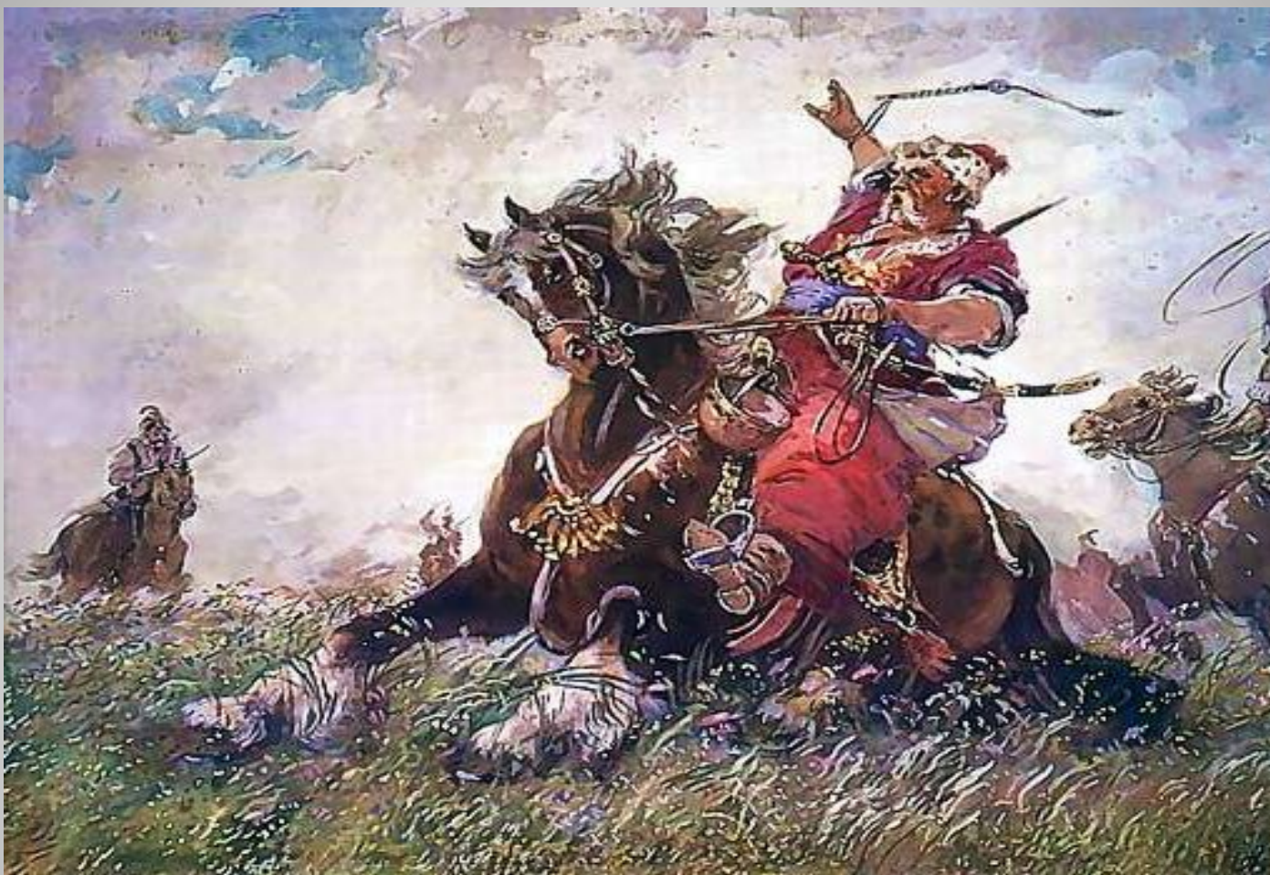
Иллюстрация к повести «Тарас Бульба»