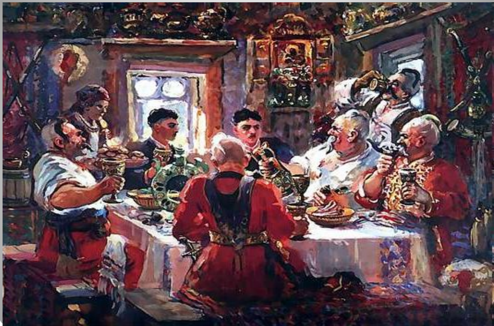
Иллюстрация к повести «Тарас Бульба»