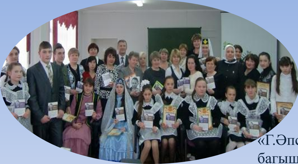
«Г.Әпсәләмовның ижатына багышланган әдәби кичә»