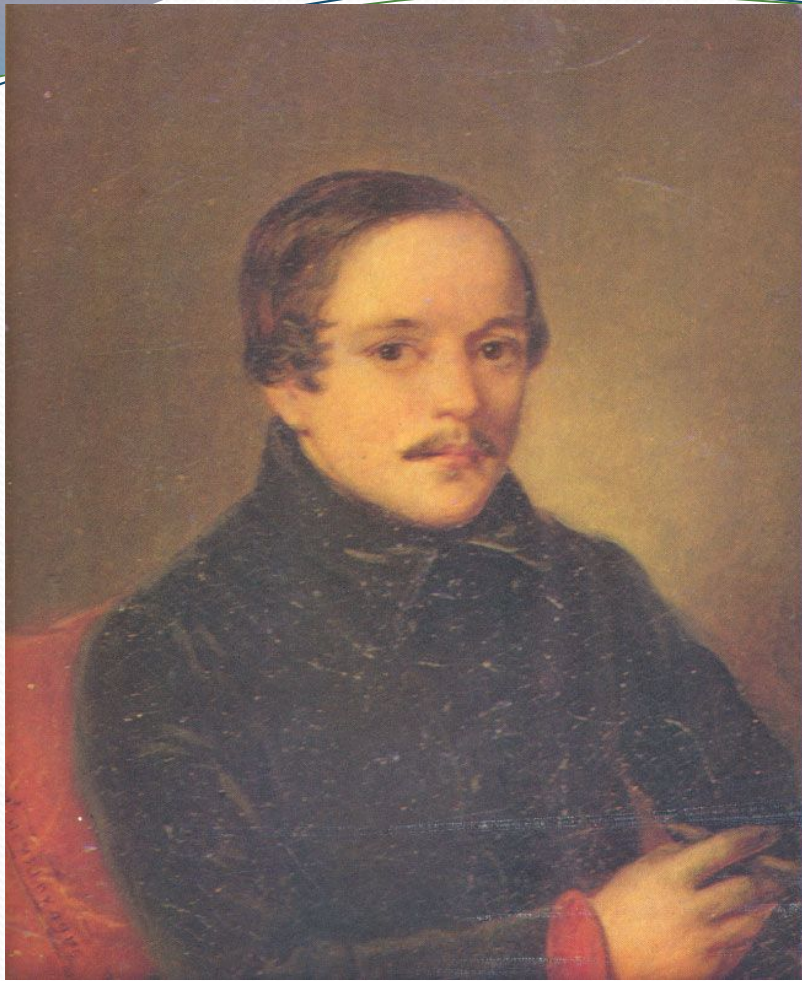
Лермонтов в штатском сюртуке. Портрет работы П. Е. Заболотского. Масло. 1840.