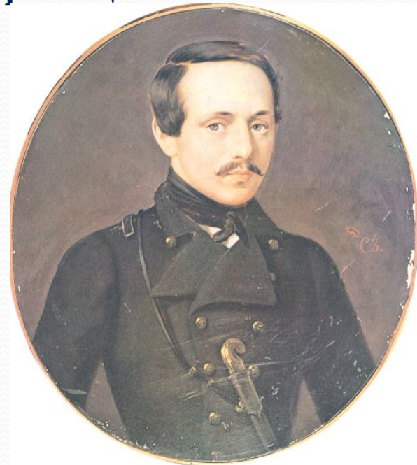
Портрет работы С. К. Зарянка. Масло. 1842(?).