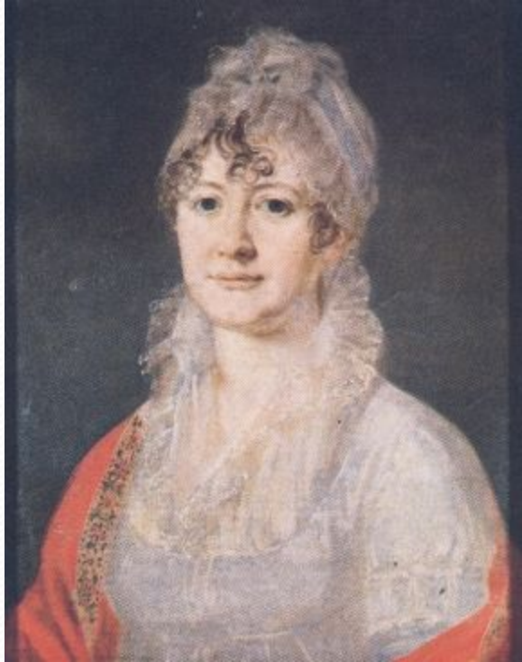
Е. А. Арсеньева, бабушка поэта. Портрет работы неизвестного художника. Масло. Начало 19 в.

Михаил Васильевич Арсеньев «был среднего роста, красавец, статный собой, крепкого телосложения; он происходил из хорошей старинной дворянской фамилии». Любил развлечения и отличался некоторой экзальтированностью: выписал себе в имение из Москвы карлика, любил устраивать различные развлечения.