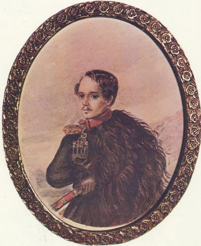
М. Ю. Лермонтов. Автопортрет. Акварель. 1837—38.

В 1840 году вышло единственное прижизненное издание стихотворений Лермонтова, в которое он включил около 28 стихотворений.