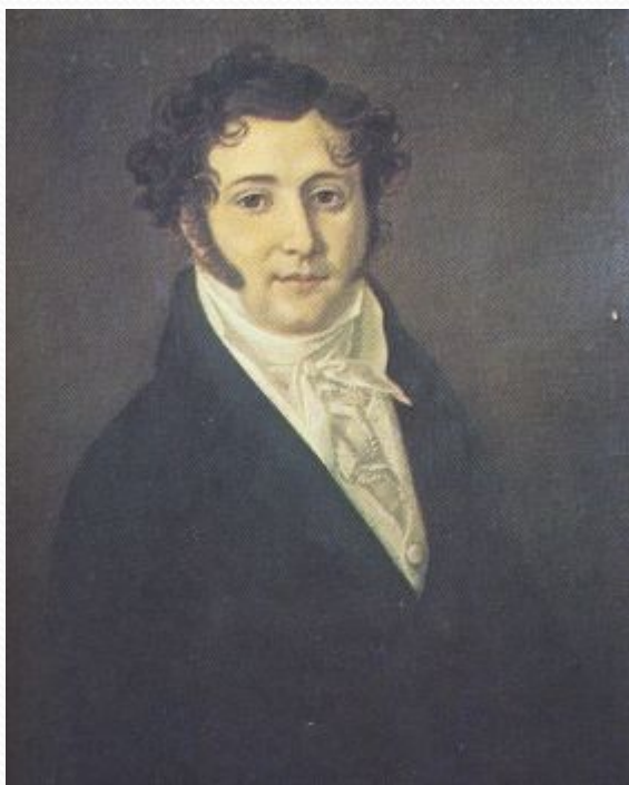
Ю. П. Лермонтов, отец поэта. Портрет работы неизвестного художника. Масло. 1810-е гг.

Прадед Михаила Лермонтова по отцовской линии - воспитанник шляхетского кадетского корпуса. В это время род Лермонтовых пользовался ещё благосостоянием; захудалость началась с поколений, ближайших ко времени поэта.