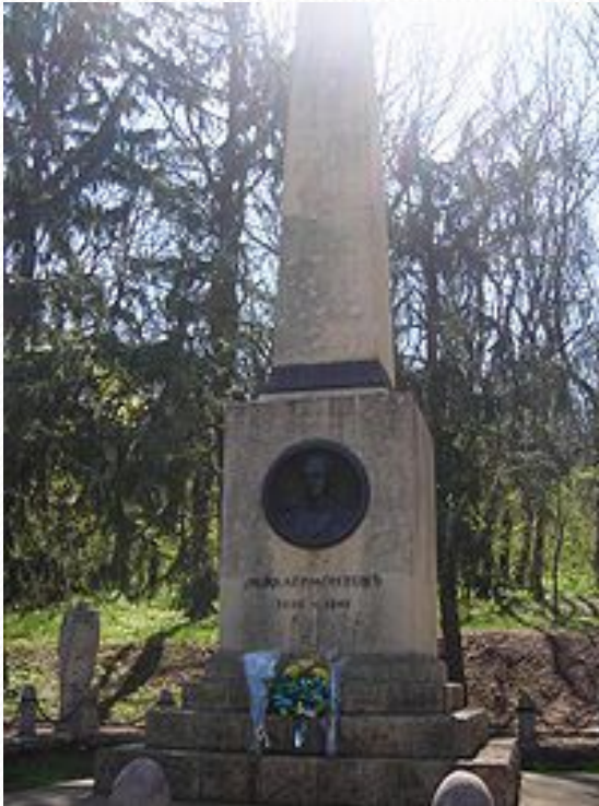
Памятник на месте дуэли М. Ю. Лермонтова

Зимой 1841 года, оказавшись в отпуске в Петербурге, Лермонтов пытался выйти в отставку, мечтая полностью посвятить себя литературе, но не решился сделать это, так как бабушка была против, она надеялась, что её внук сможет сделать себе карьеру и не разделяла его увлечение литературой. Поэтому весной 1841 года он был вынужден возвратиться в свой полк на Кавказ.