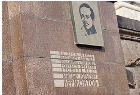
Памятная доска на месте рождения М. Ю. Лермонтова

После свадьбы семья Лермонтовых поселилась в Тарханах . Однако рожать свою, не отличавшуюся крепким здоровьем, молодую жену Юрий Петрович повёз в Москву, где можно было рассчитывать на помощь опытных врачей. Там в ночь с 2 на 3 октября 1814 года в доме напротив Красных ворот (сейчас на этом месте находится высотное здание, на котором есть памятная доска с изображением М. Ю. Лермонтова) на свет появился великий русский поэт.