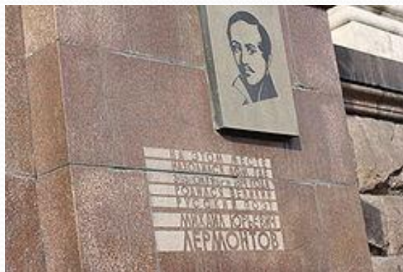
Памятная доска на месте рождения М. Ю. Лермонтова

После свадьбы семья Лермонтовых поселилась в Тарханах . Однако рожать свою, не отличавшуюся крепким здоровьем, молодую жену Юрий Петрович повёз в Москву, где можно было рассчитывать на помощь опытных врачей. Там в ночь с 2 на 3 октября 1814 года в доме напротив Красных ворот (сейчас на этом месте находится высотное здание, на котором есть памятная доска с изображением М. Ю. Лермонтова) на свет появился великий русский поэт.