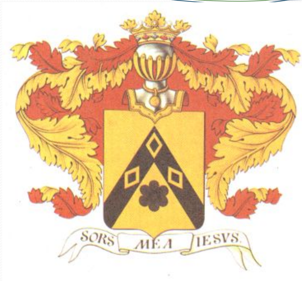
Герб рода Лермонтовых.