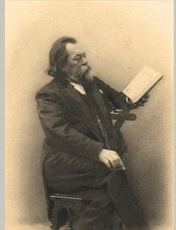
Федор Николаевич Плевако (1842-1908 гг.)

Аргументы ссылки на признанные авторитеты