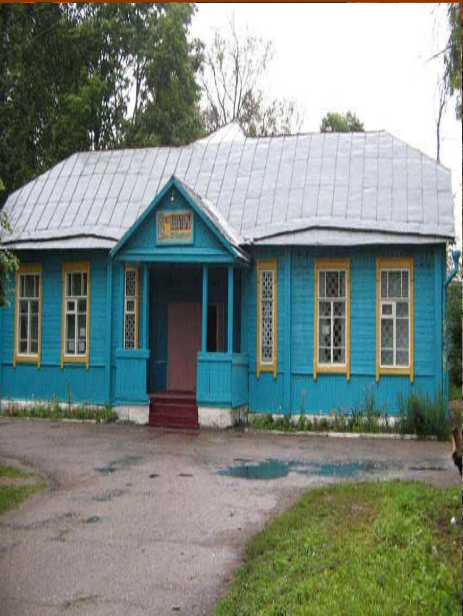
Музей песни «Катюша» (п. Выходы Угранского района Смоленской области)

Музей песни «Катюша» открыт летом 1985 г. в Доме культуры, построенном на средства самого поэта. В экспозиции и фондах музея постепенно было собрано большое количество экспонатов личного характера. Это дало возможность переименовать его в мемориальный музей Михаила Васильевича Исаковского.