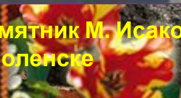
Памятник М. Исаковскому в Смоленске

Давно закончилась война, и порой кажется, что мы забыли, какой ценой досталась нашим прадедам Победа, но это не так. Искусство вновь и вновь возвращает нас в военные годы. Чем дальше уходит от нас военная пора, тем больше согревают и трогают нас за душу лирические песни.