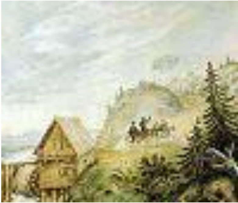
Пейзаж с мельницей и скачущей тройкой