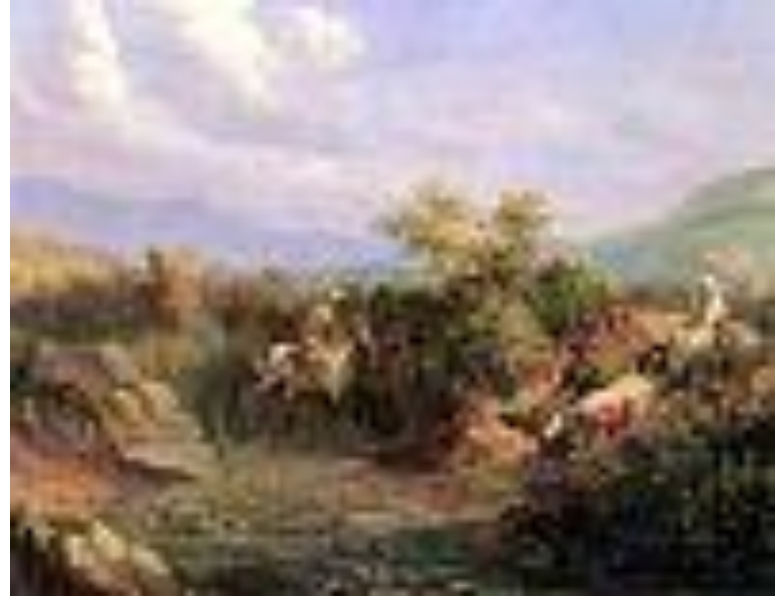
Нападение. Сцена из кавказской жизни