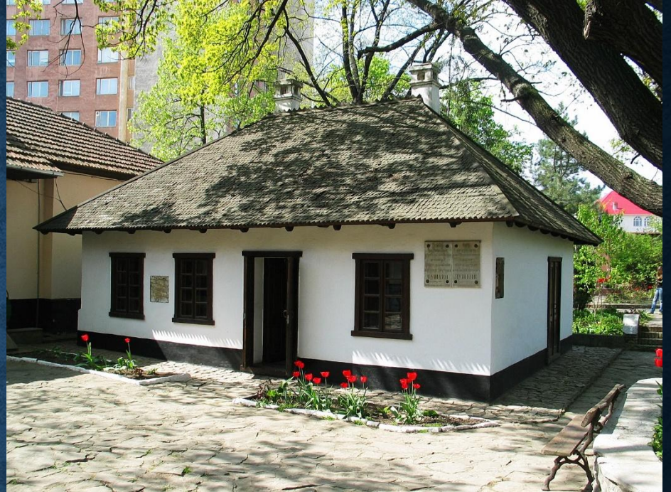
Дом-музей А. С. Пушкина в Кишиневе, где поэт останавливался в 1820 г.

Однажды Пушкина вызвали к генерал-губернатору Милорадовичу, и тот хотел направить полицейского на квартиру поэта опечатать его бумаги. Пушкин сказал ему: «Все мои стихи сожжены – у меня ничего не найдете на квартире. Лучше прикажите подать бумагу, я здесь же вам все напишу».