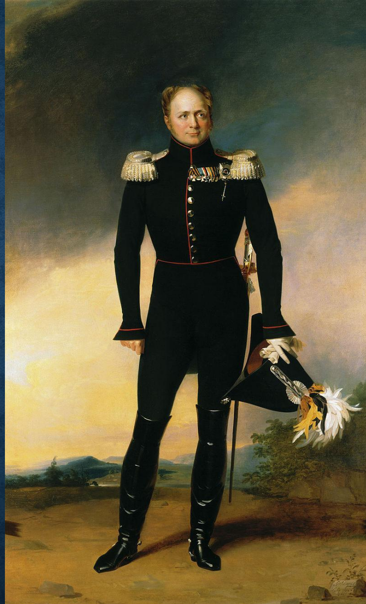
Алекса́ндр I Павлович император и самодержец Всероссийский (с 12(24) марта 1801

Окончив лицей, А.С. Пушкин поселился в Петербурге. Столичная жизнь с балами, театрами, литературными обществами захватила юного поэта. Он часто вступал в споры о свободе в России. Вольнолюбивые стихи Пушкина, эпиграммы на царя и его приближённых распространились по всему Петербургу, дошли они и до царя.