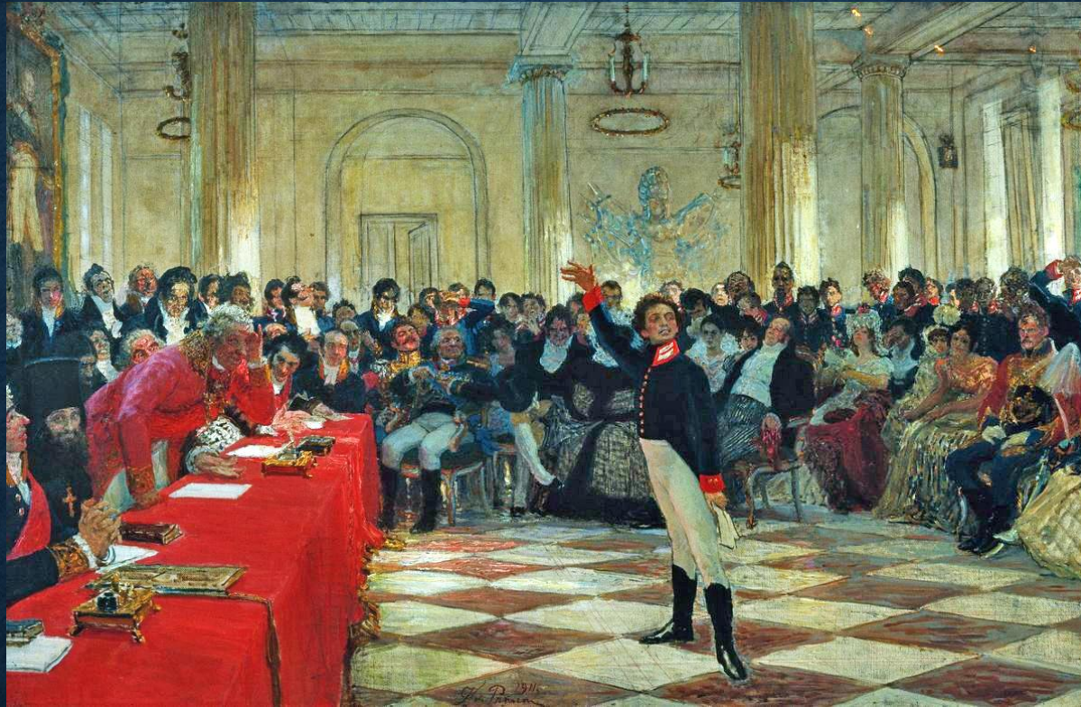
Рис. 6. Репродукция картины И. Репина «Пушкин на лицейском экзамене в Царском Селе». 1911

В 1815 году на публичном экзамене Александр Сергеевич Пушкин прочитал своё стихотворение в присутствии знаменитого поэта Гавриила Романовича Державина. Державин был стар, экзамены его утомили, но вот начался экзамен по русской словесности (рис. 6).