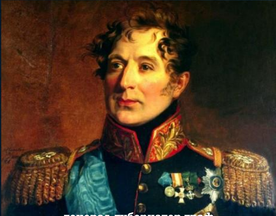
генерал-губернатор граф Михаил Андреевич Милорадович