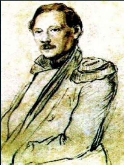
Рис. 1. Данзас Константин Карлович, российский армейский офицер, друг А. С. Пушкина

Однажды Николай Фёдорович закончил урок раньше обычного. Мальчики удивились – почему? А он внимательно посмотрел на учеников, улыбнулся и торжественно сказал: «Теперь, господа, будем пробовать перья. Опишите мне, пожалуйста, розу стихами». Тишина в классе, все склонились над тетрадями: с чего начать? Как трудно, оказывается, написать первую строчку. Данзас (рис. 1) смотрит в потолок, Мясоедов (рис. 2) заглядывает в тетрадь соседа, Кюхельбекер (рис. 3) зачеркнул всё написанное и начал снова. Как описать розу? Без фантазии и вдохновения не обойтись. Роза – алая, душистая, колючая, свежая... И правда, нелёгкое это дело – творить. Первым подбегает к профессору Алосенька Илличевский (рис. 4): «Готово стихотворение!», - и гордо оглядывается на товарищей. Но Николай Фёдорович читает, отрицательно качает головой и молча возвращает тетрадь. «А вы, господин Пушкин, почему перо отложили?» Александр протягивает ему листок: несколько строк написано летящим почерком.