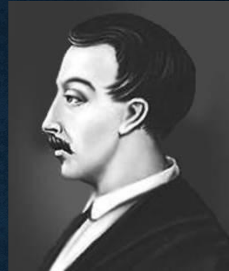
Рис. 3. Кюхельбекер Вильгельм Карлович, русский поэт, писатель и общественный деятель, друг и одноклассник Пушкина по Царскосельскому лицее