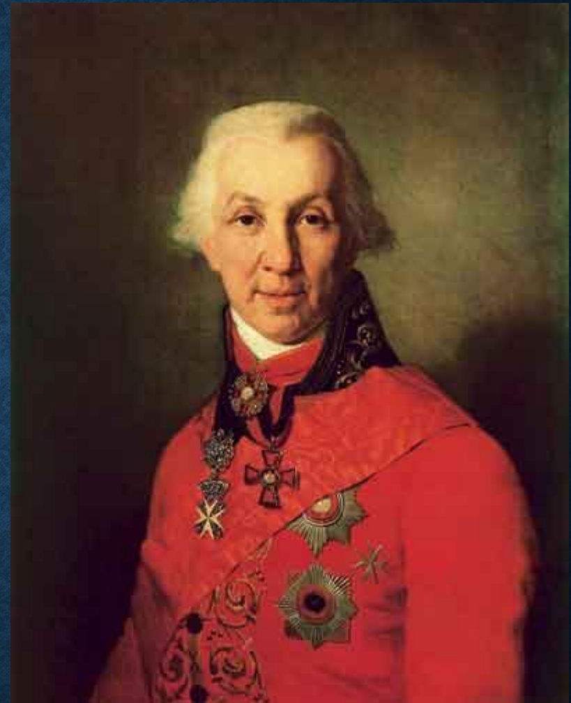
ДЕРЖАВИН Гаврила Романович (03.07.1743-08.07.1816 гг.) - государственный деятель, поэт.

Слава юного поэта распространилась и в литературных кругах, так как первые его стихи уже печатались и были высоко оценены литературной общественностью. В лицей приезжали знаменитые поэты: Жуковский, Батюшков, для того чтобы познакомиться с ним.