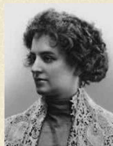
Гиппиус З. Н.