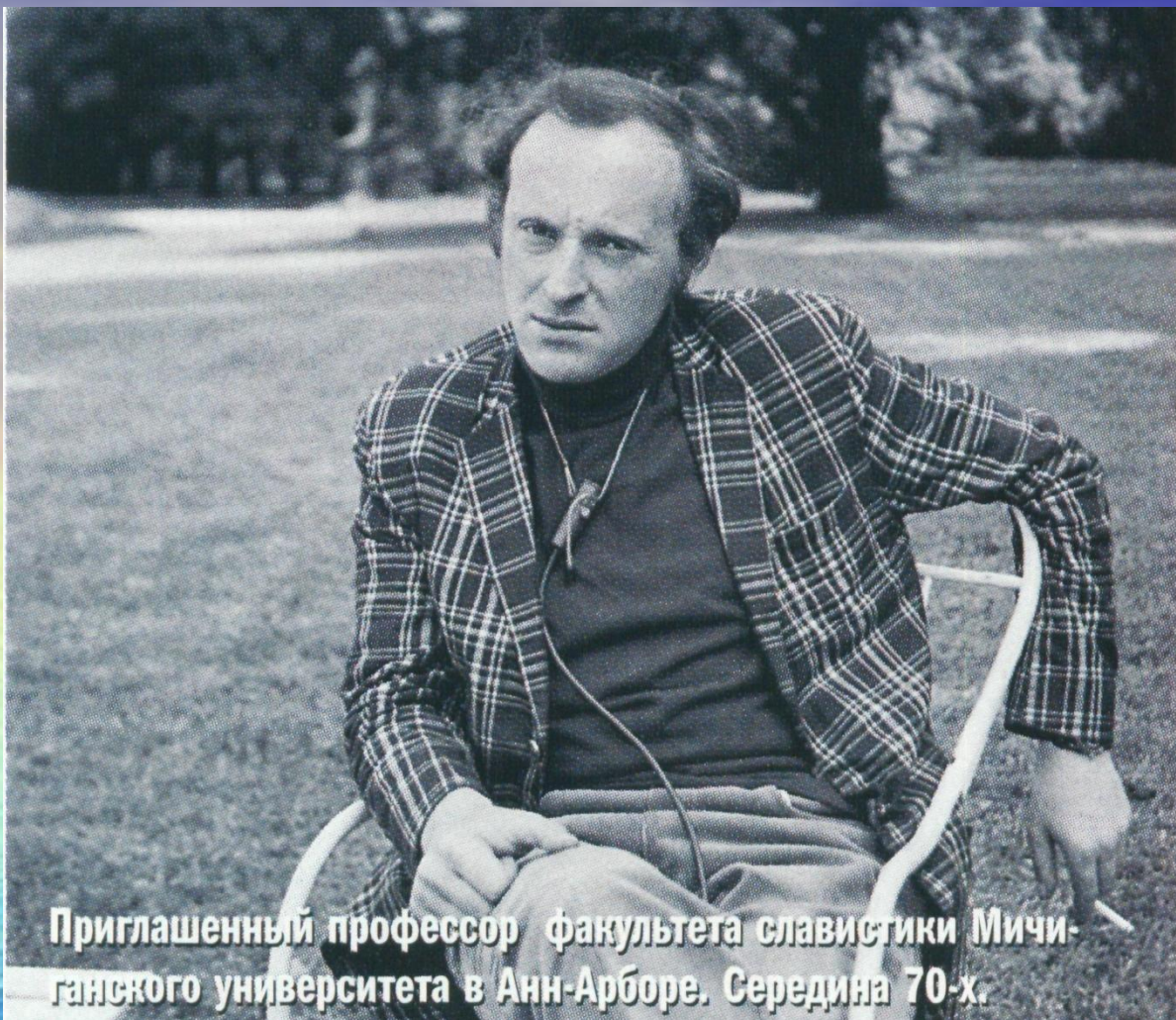
Приглашенный профессор факультета славистики Мичиганского университета в Анн-Арборе. Середина 70-х.