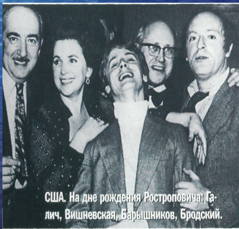
США. На дне рождения Ростроповича: Галлич, Вишневская, Барышников, Бродский.