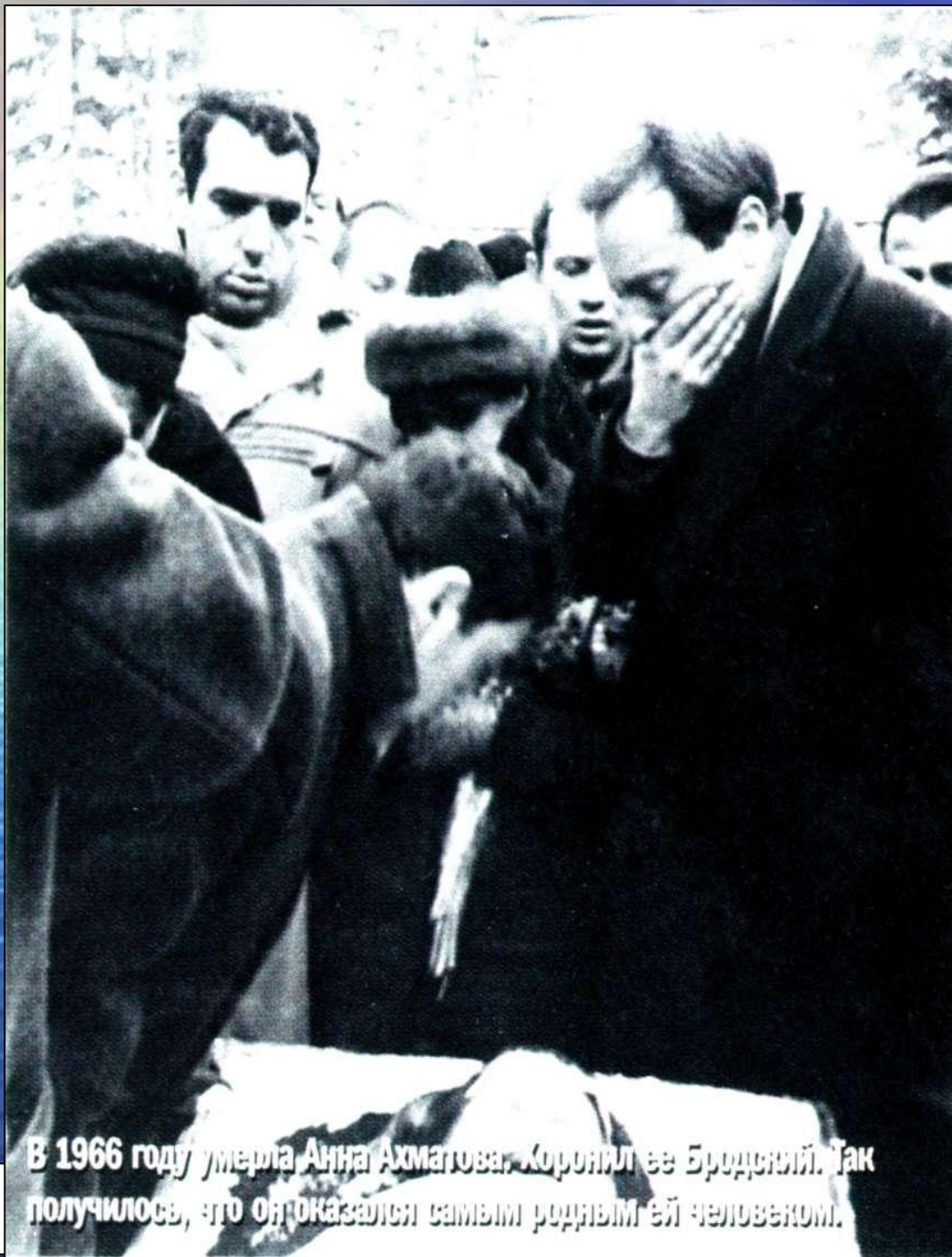
В 1966 году умерла Анна Ахматова. Коронил ее Бродский. Так получилось, что он оказался самым родным ей человеком.

1961 году Евгений Рейн познакомил Бродского с Анной Ахматовой. «В те времена, - рассказывал об этой встрече Бродский, - я был абсолютный дикарь, дикарь во всех отношениях - в культурном, духовном, я думаю, что если мне и привились некоторые элементы христианской этики, то произошло это благодаря ей, ее разговорам, скажем, на темы религиозного существования. Просто то, что эта женщина простила врагам своим, было самым лучшим уроком для человека молодого, уроком того, что является сущностью христианства. После нее я не в состоянии, по крайней мере, до сих пор, всерьез относиться к своим обидчикам». Анна Бродского «своим». Она называла его «наш рыжий» и очень переживала за его судьбу.