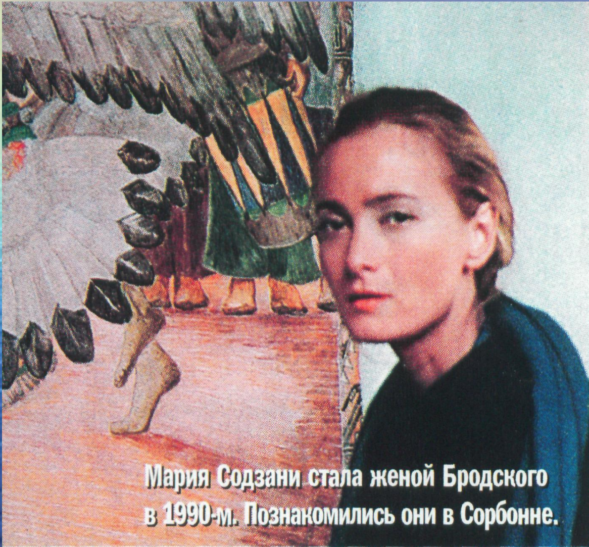
Мария Содзани стала женой Бродского в 1990-м. Познакомились они в Сорбонне.