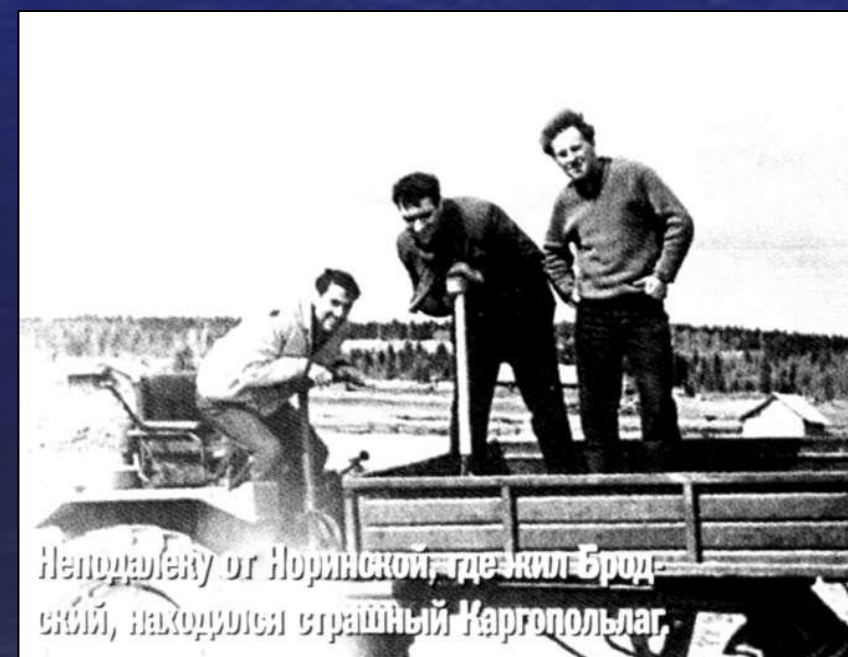
Неподалёку от Норинской, где жил Бродский, находился страшный Каргопольлаг.