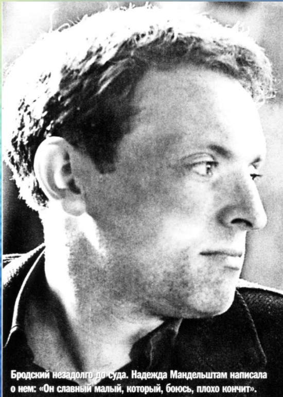
Бродский незадолго до суда. Надежда Мандельштам написала о нем: «Он славный мальчик, который, боюсь, плохо кончит».

Те, кто интересовался поэзией, хорошо знали имя Бродского, его первые стихи: «Еврейское кладбище в Ленинграде», «Пилигримы», «Воротишься на родину...». Бродский много читал свои стихи в студенческих аудиториях. Слышавшие его первые выступления говорили, что это было «уникальное и потрясающее явление абсолютного слияния личности и результата творчества». Он уже знал, что поэзия – главное в его жизни.