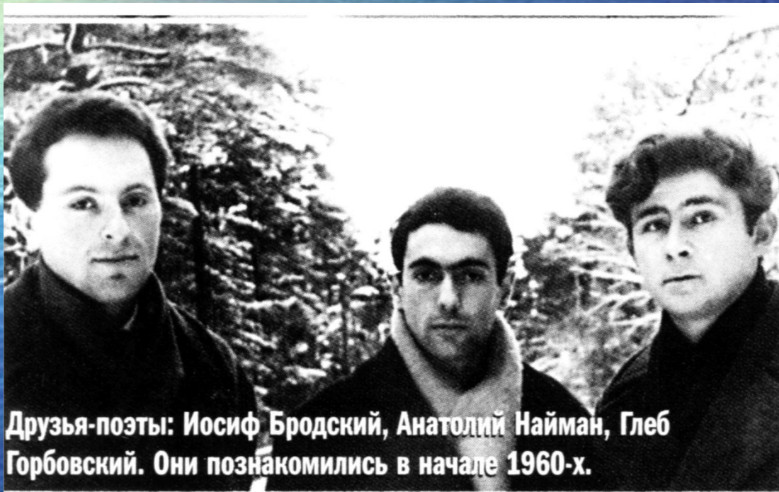
Друзья-поэты: Иосиф Бродский, Анатолий Найман, Глеб Горбовский. Они познакомились в начале 1960-х.

Он работал на заводе фрезеровщиком, пытался поступить в Балтийское училище подводного плавания, работал санитаром в морге (мечтал стать нейрохирургом), истопником в котельной, смотрителем маяка. Чтобы иметь возможность посещать вольнослушателем лекции в университете, устроился в 1957 году в геологическую партию. Работал на Белом море, в Средней Азии, на Дальнем Востоке, в Якутии. Тогда его, как он писал, «толкнуло к стихам»: «В Якутске зашёл в книжный магазин и в нём надыбал Баратынского. Читать было нечего, и когда я нашёл эту книжку и прочёл её, тут-то я всё понял: чем надо заниматься».