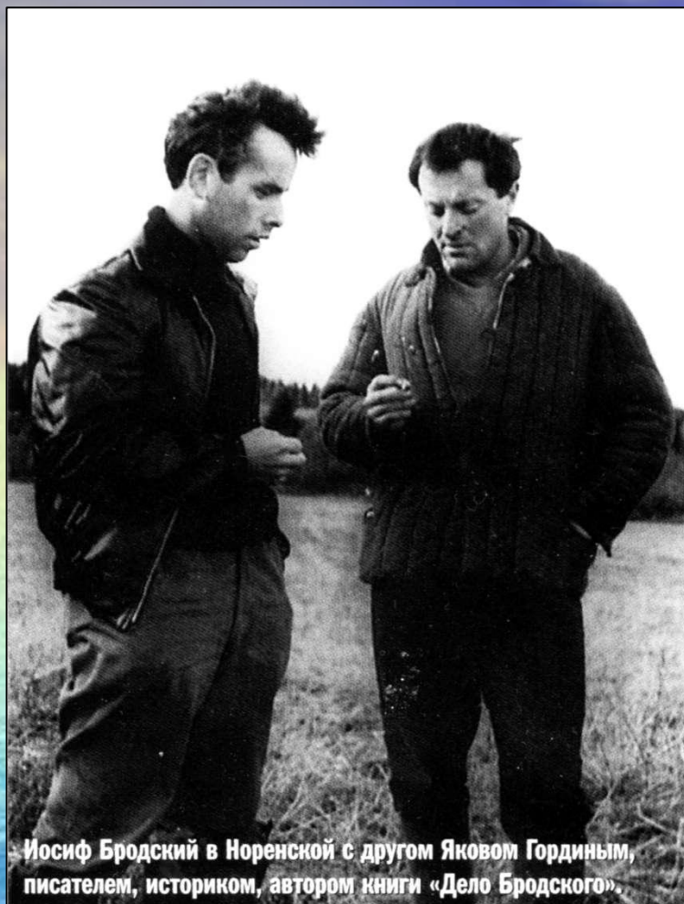
Иосиф Бродский в Норенской с другом Яковом Гординым, писателем, историком, автором книги «Дело Бродского»

в 1965 году в Нью-Йорке вышла первая, составленная Глебом Струве, книга стихов, переведённая затем на французский, немецкий и голландский языки.