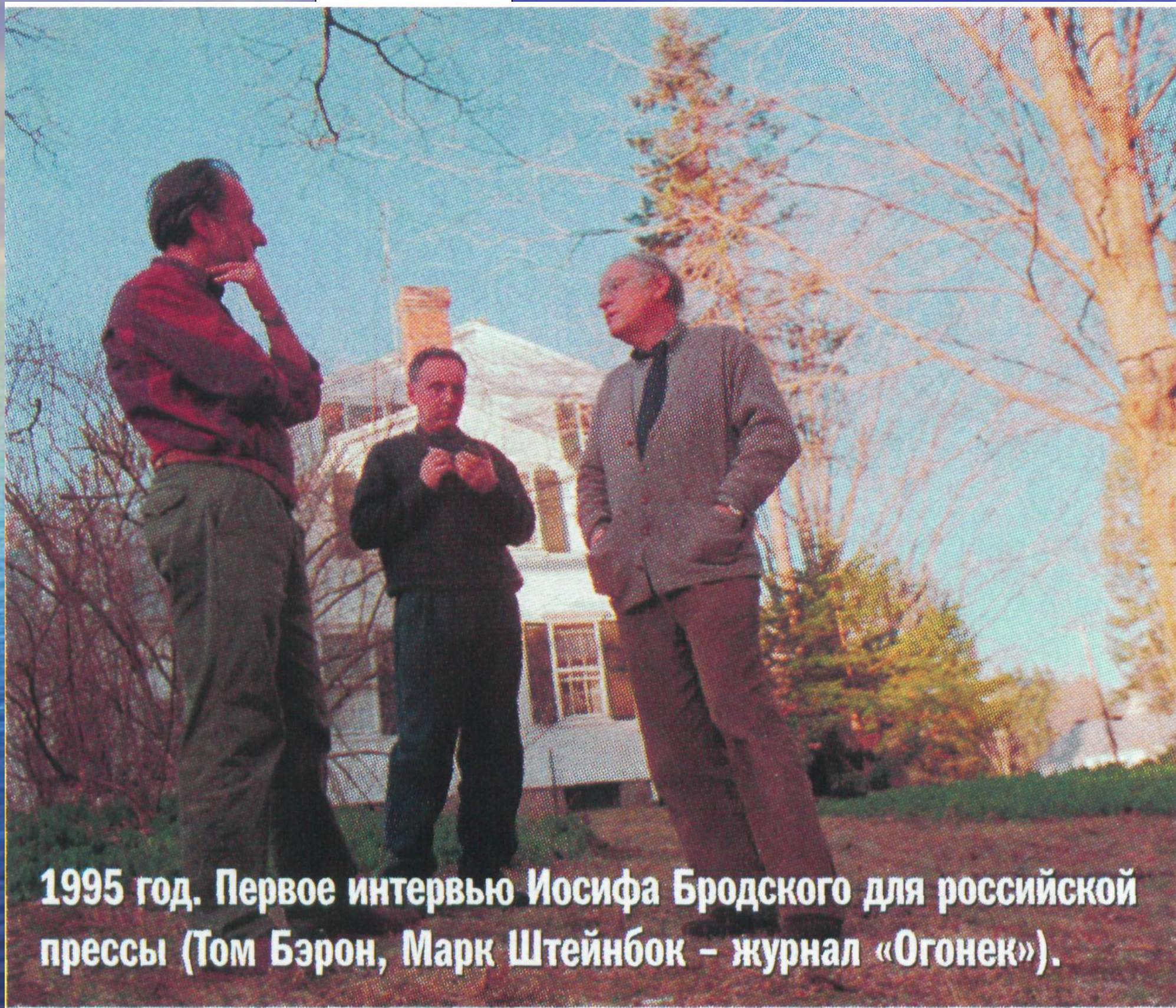
1995 год. Первое интервью Иосифа Бродского для российской прессы (Том Бэрн, Марк Штейнбок – журнал «Огонек»).