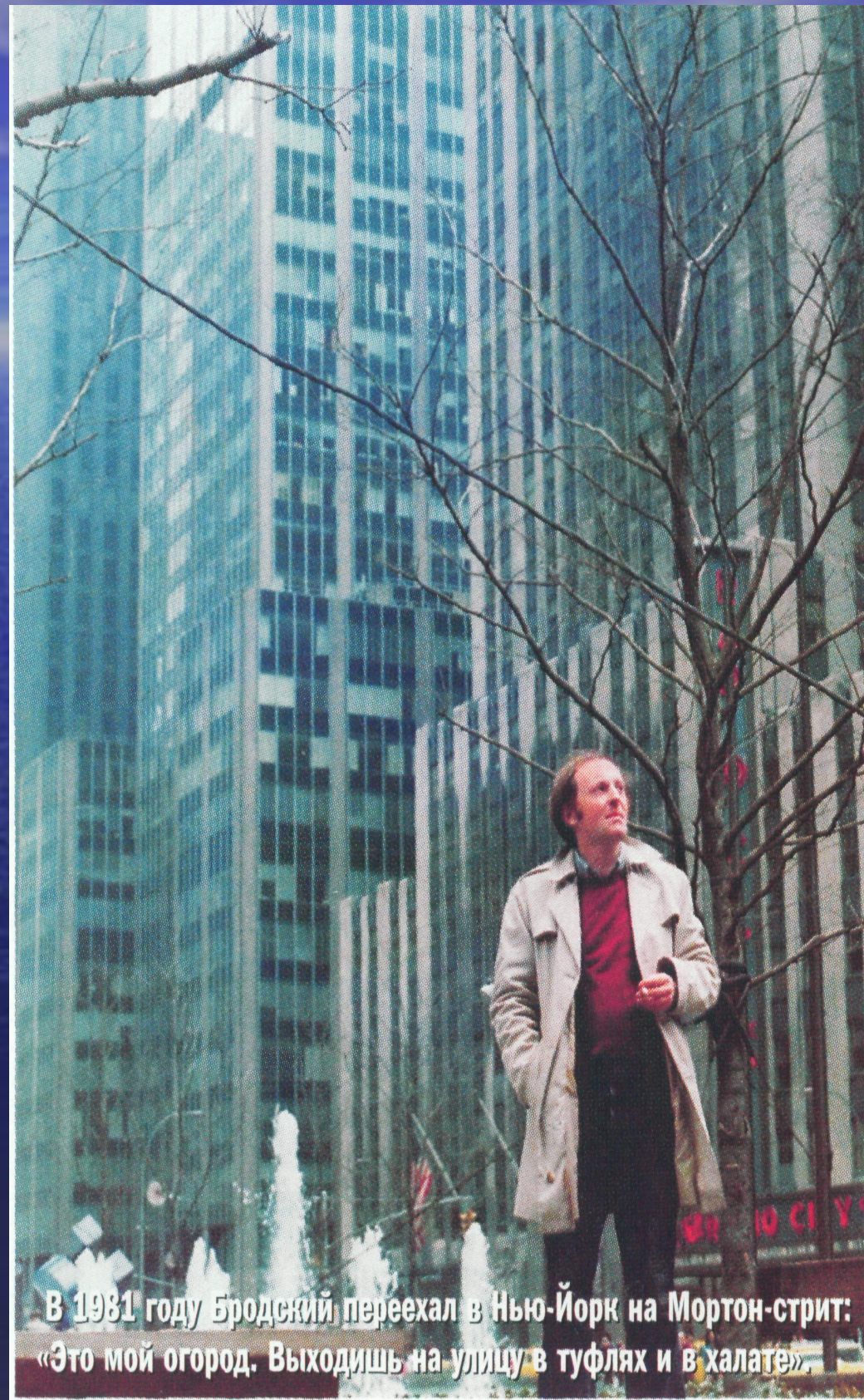
В 1981 году Бродский переехал в Нью-Йорк на Мортон-стрит: «Это мой огород. Выходишь на улицу в туфлях и в халате».