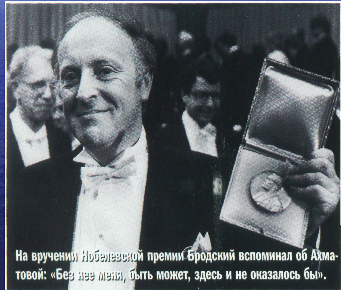
На вручении Нобелевской премии Бродский вспоминал об Ахматовой: «Без нее меня, быть может, здесь и не оказалось бы».

«Если искусство чему-то учит, то именно частности человеческого существования. Будучи наиболее древней – и наиболее буквальной – формой частного предпринимательства, оно вольно или невольно поощряет в человеке именно его ощущение индивидуальности, уникальности, отдельности – превращая его из общественного животного в личность». (из нобелевской лекции Иосифа Бродского).