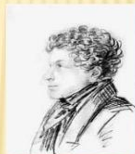
Брат, Лев Сергеевич Пушкин (1805- 1852г.)