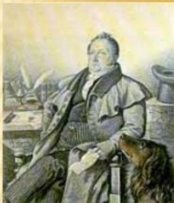
Отец, Сергей Львович Пушкин (1770- 1838г.)