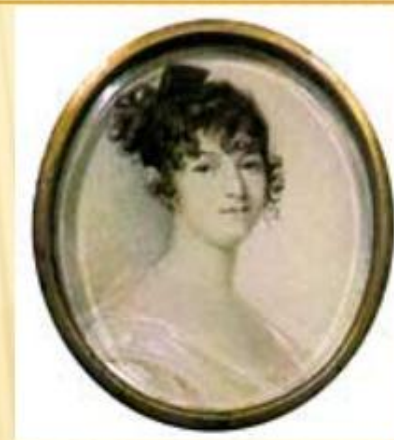
Мать, Надежда Осиповна Пушкина (1775- 1836г.)