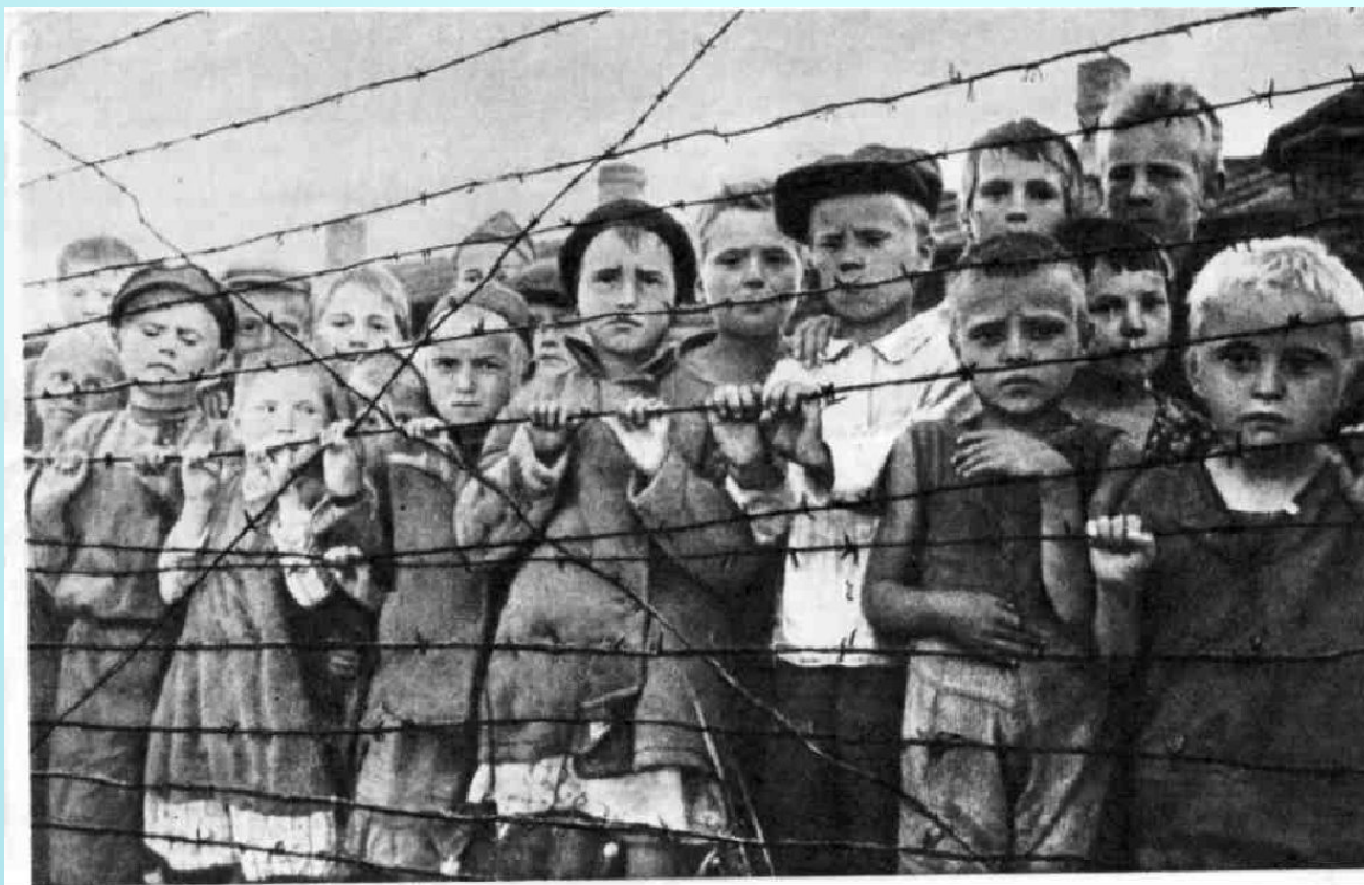
Дети из оккупированных районов СССР перед насильственной отправкой в Германию. 1944 г.