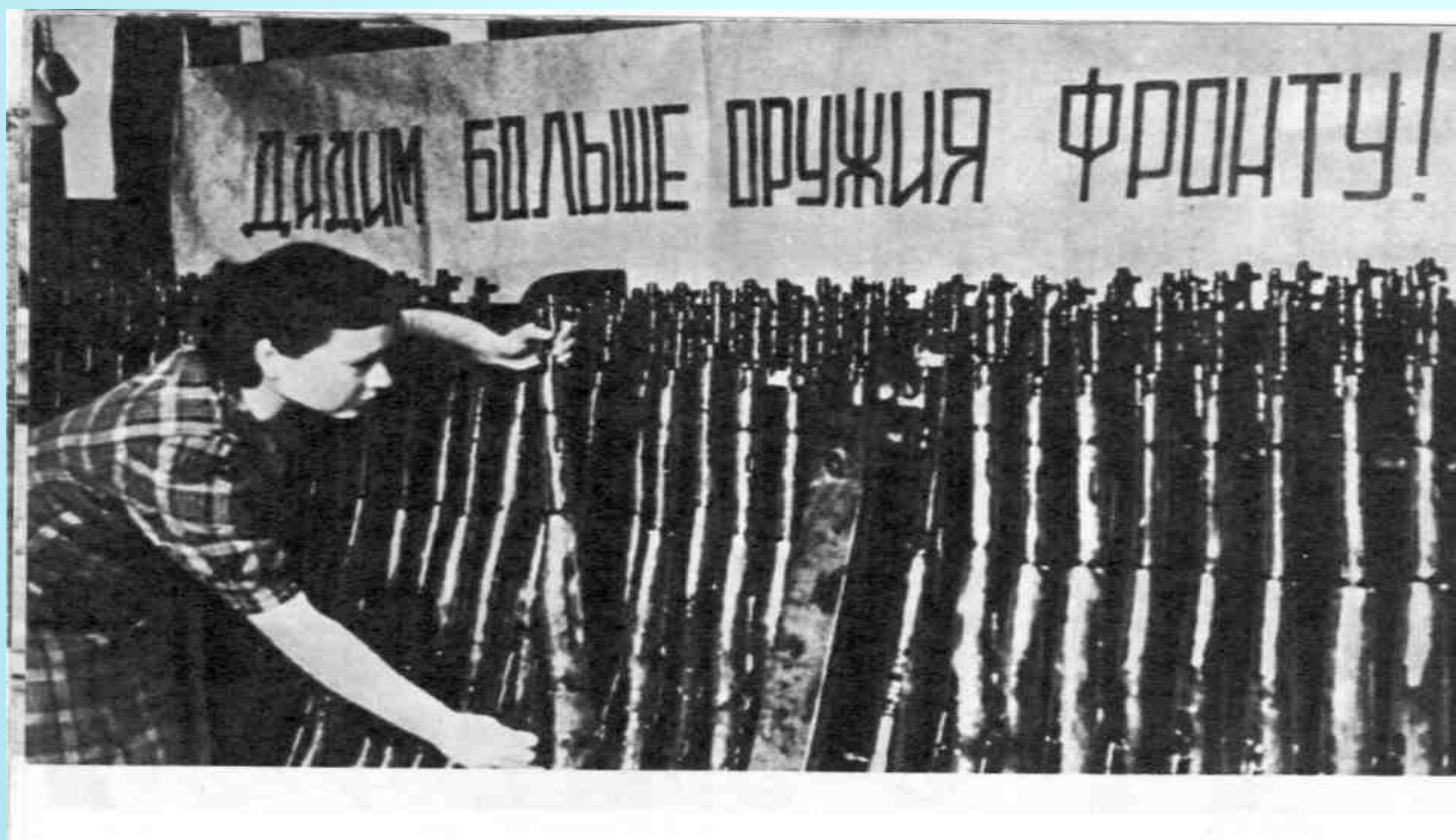
Тульские оружейники фронту