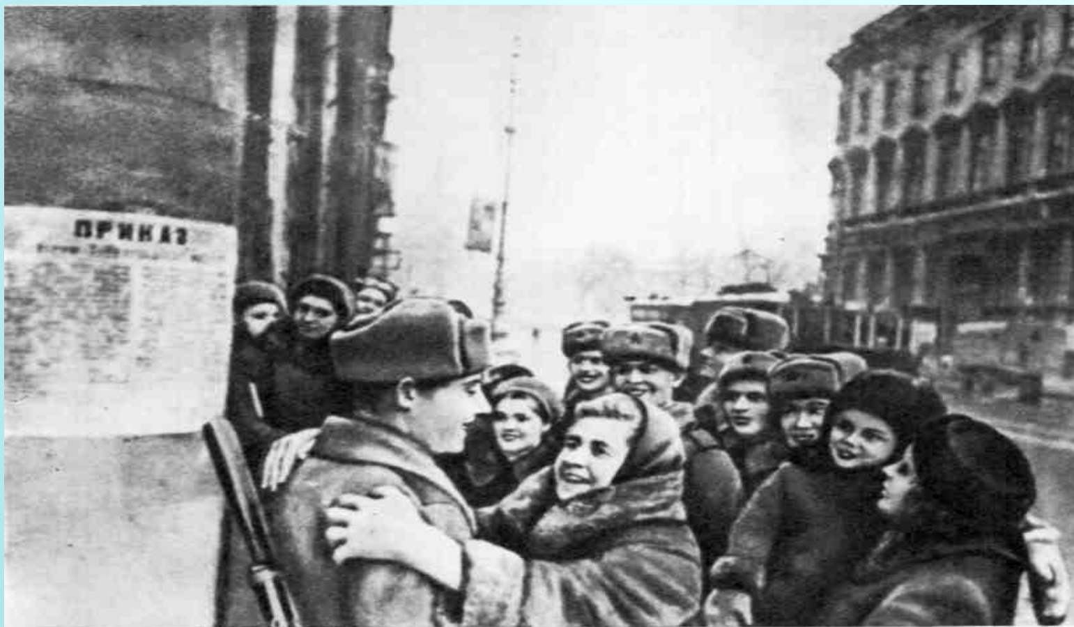
Ленинградцы благодарят воинов Советской Армии за окончательное снятие вражеской блокады. 27 января 1944 г.