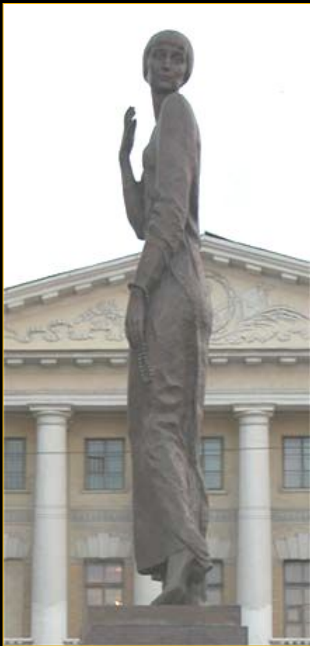
Памятник А.А.Ахматовой в Санкт-Петербурге