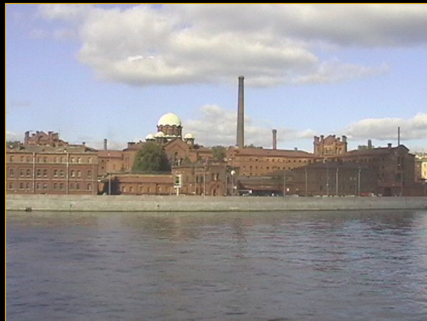
Кресты. Тюрьма в Санкт- Петербурге