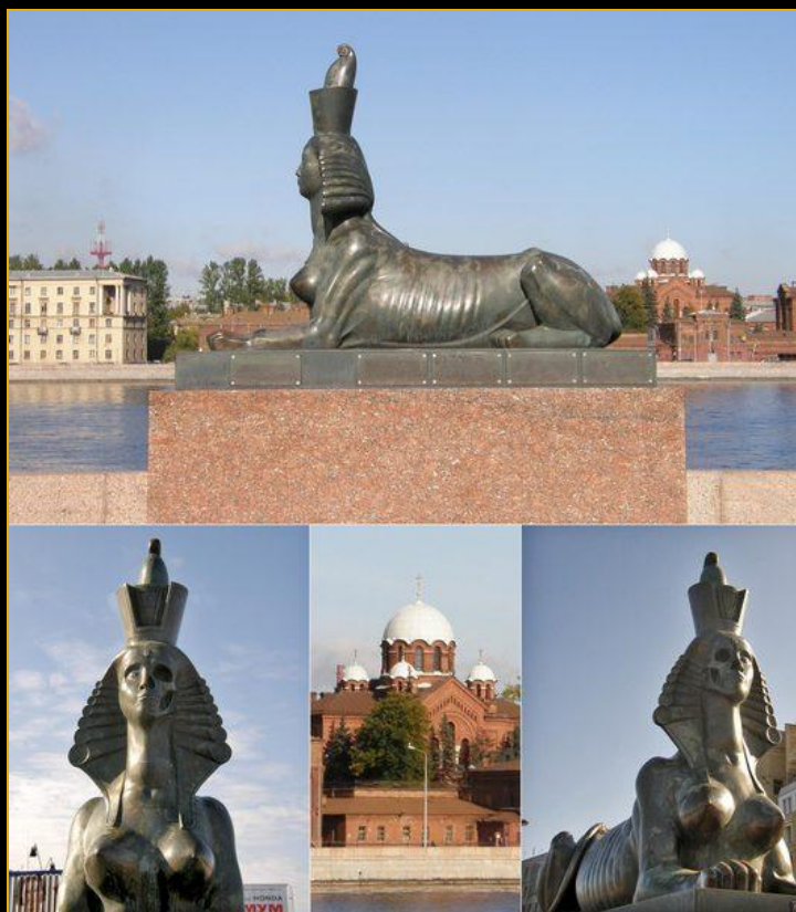
Памятник жертвам политических репрессий в Санкт- Петербурге

Назвав свое произведение «Реквием», Ахматова открыто заявляла о том, что ее поэма – надгробное слово, посвященное всем погибшим в страшные времена сталинских репрессий, а также тем, кто страдал, переживая за близких, в ком от страдания умирала душа.