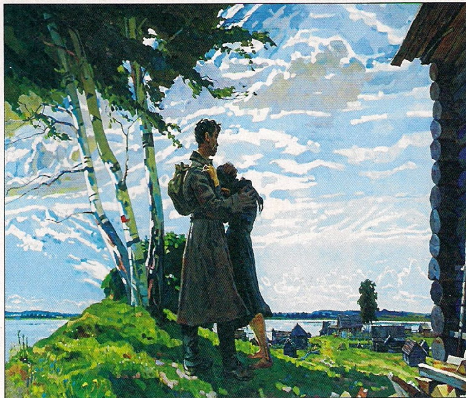
А.Горский. Без вести пропавший. 1975