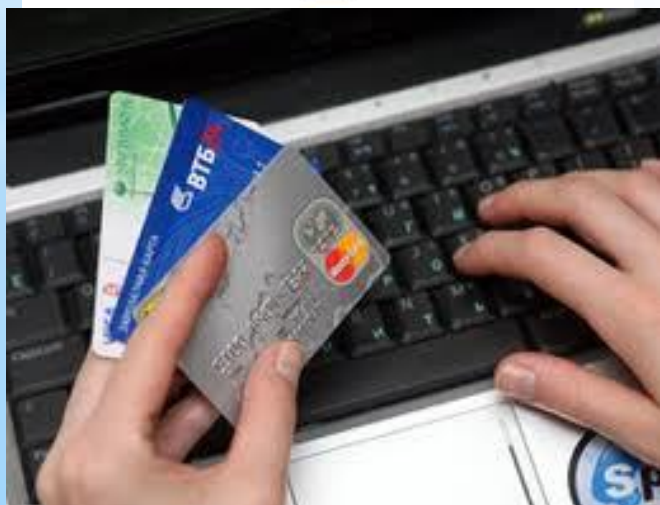
Экономика и торговля