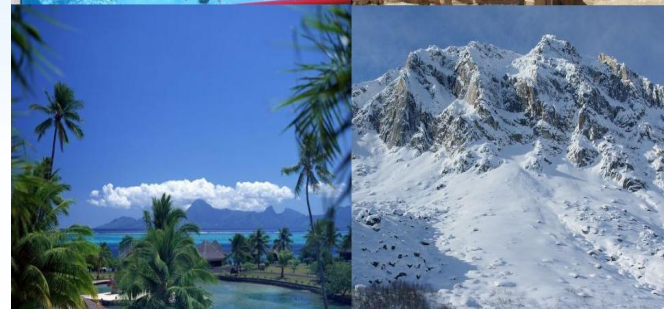
Спорт и туризм