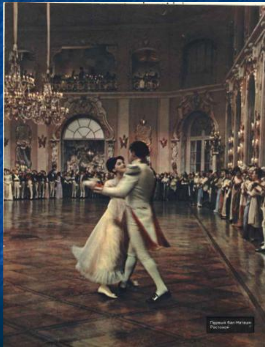
Первый Бал Наташи Ростовых

ВЫВОД: Настоящий душевный подъем испытывает Андрей Болконский при встрече с Наташей Ростовой. Общение с ней открывает для него новую сторону жизни: любовь, красоту, поэзию.