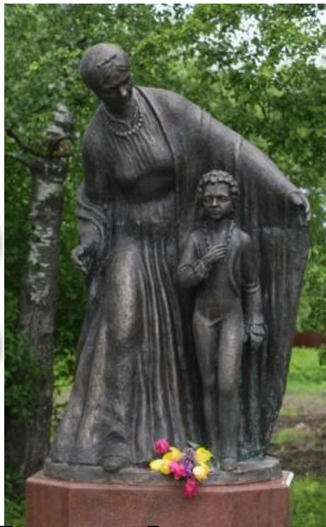
Памятник в Воскресенском