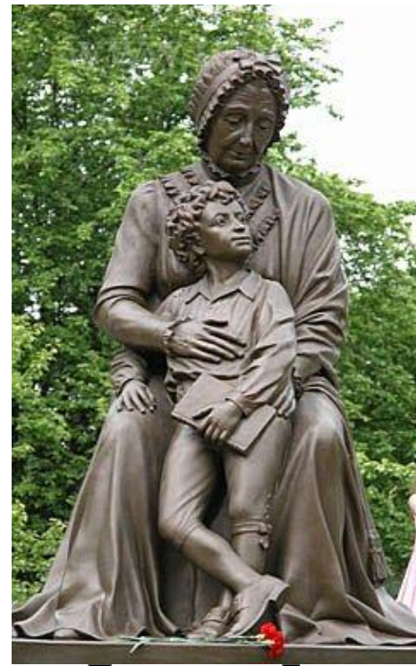
Памятник в Гатчине