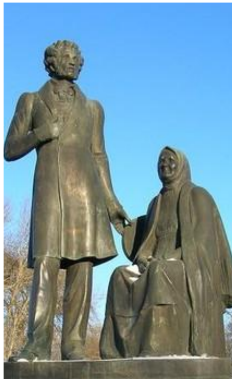
Памятник в Пскове