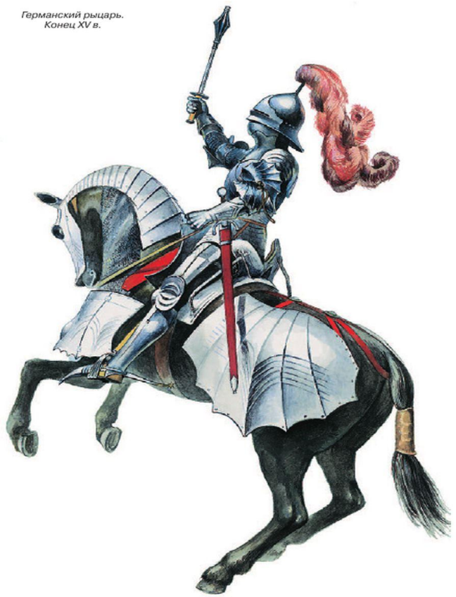
Германский рыцарь. Конец XV в.