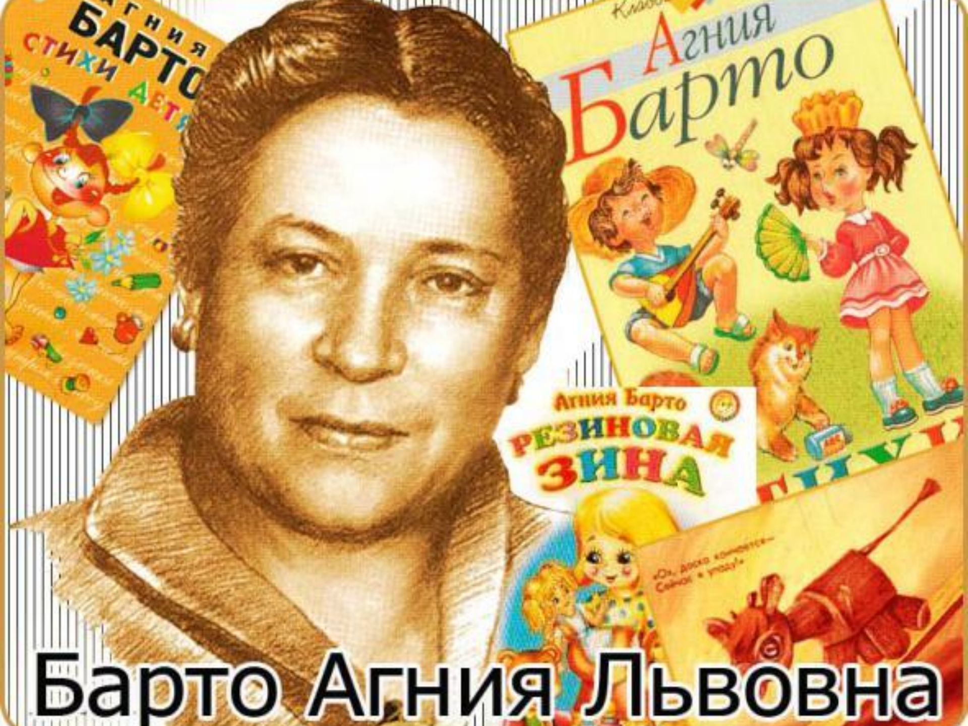
Барто Агния Львовна