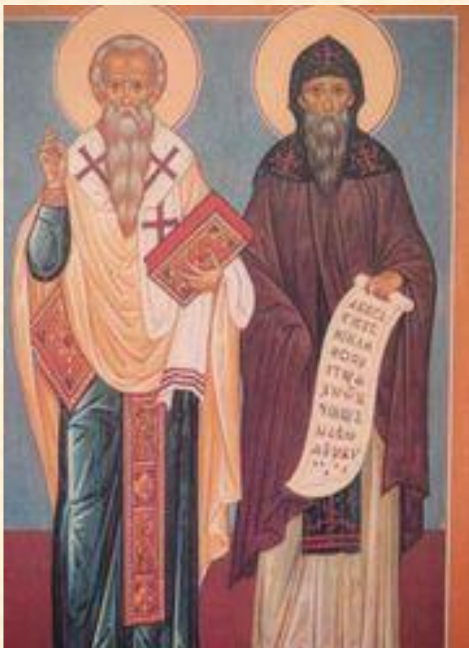
Святые Кирилл и Мефодий

флософа . несприма дръволии . чѣпѣ ншн плачеве го сласта и сѣра . не ка миньм драгаго . не ко гат . еста цреходѣщаго . не по днени а не спѣшно оустверди стирск чь . не вѣст мѣрѣмъ в не ка стирска . не въ