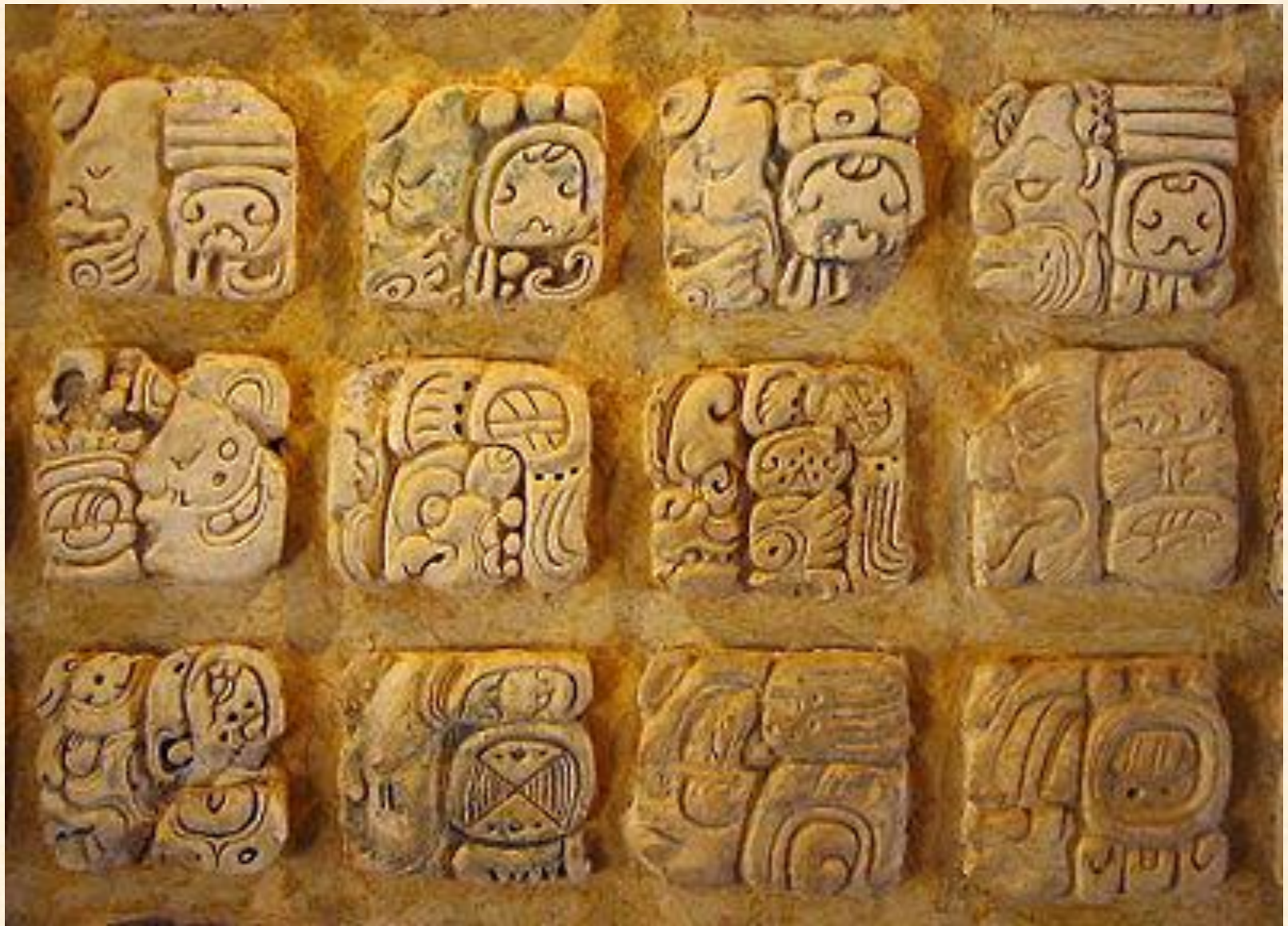
Иероглифы майя Мексика