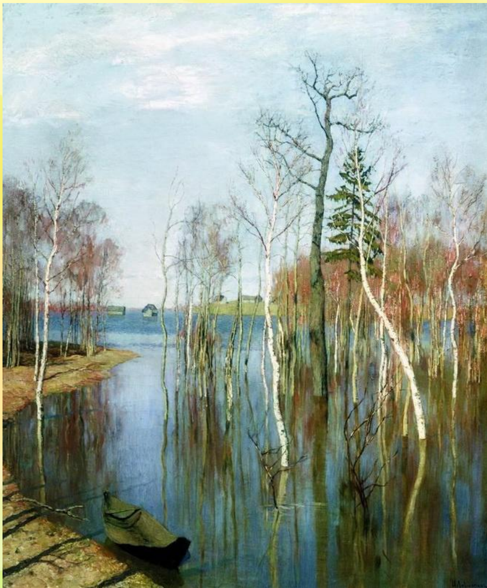
ИСААК ЛЕВИТАН Весна- большая вода