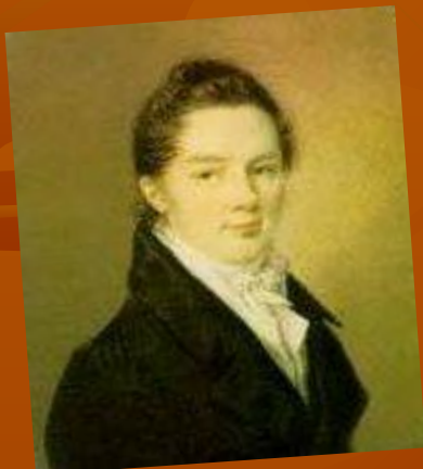
И.И. Пуцин Ф.Верне. 1817г.