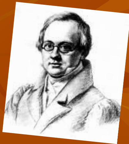
А.П. Дельвиг В.П. Лангер. 1830г