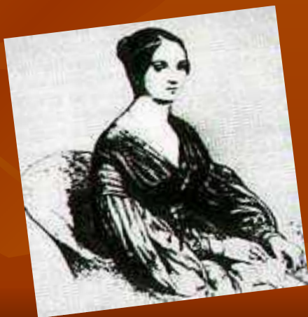
Анна Петровна Керн 1800-1879г.