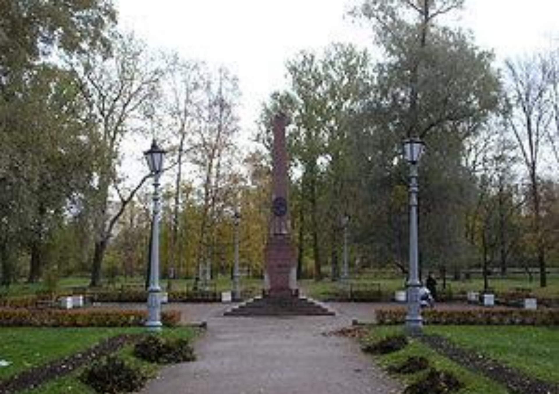
Памятный обелиск на месте дуэли Пушкина.