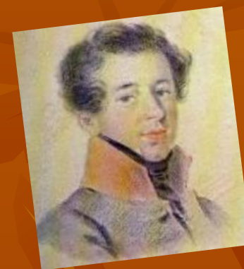
А.М. Горчаков Неизв. худ. 1810-е г.