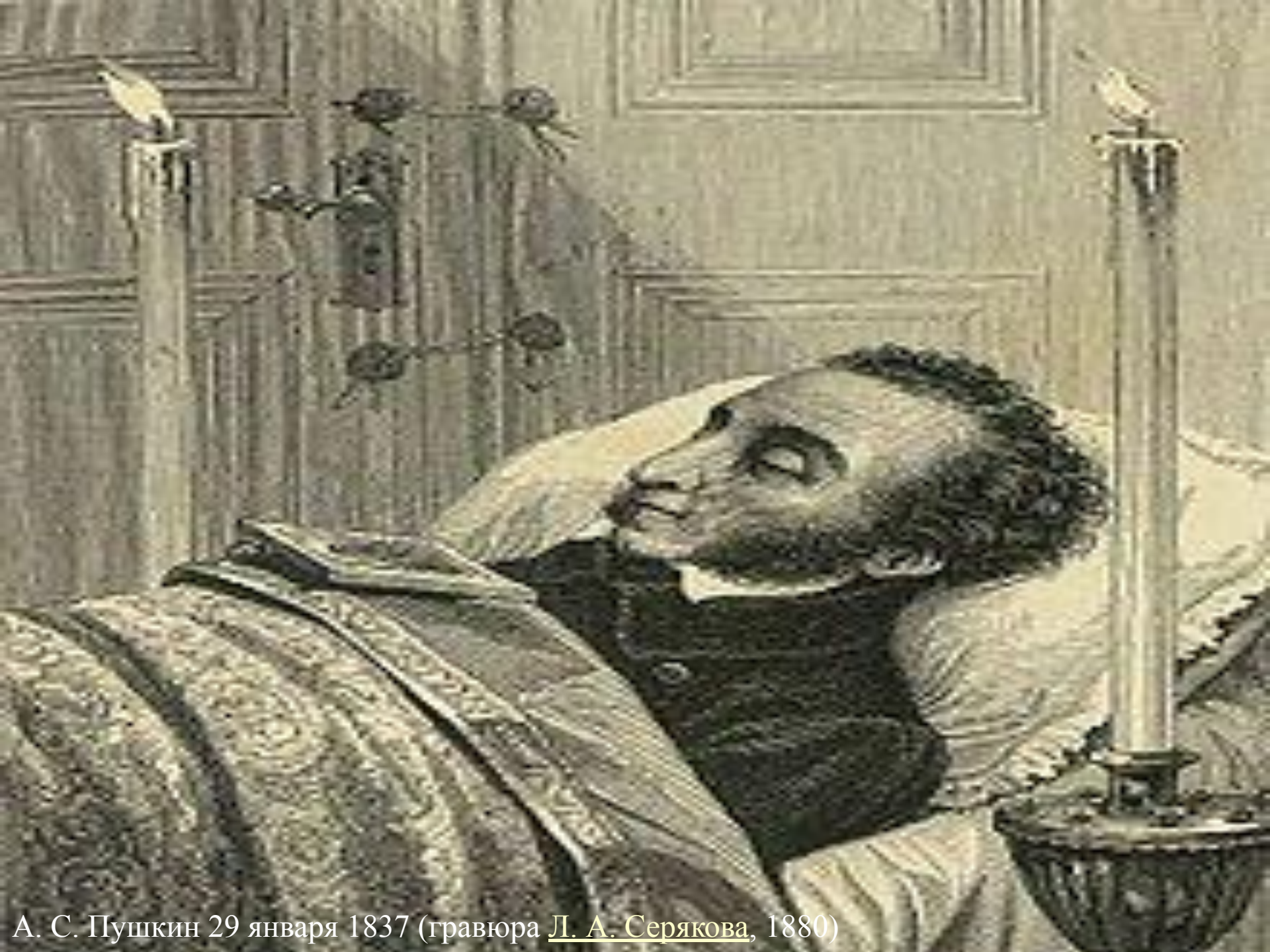
А. С. Пушкин 29 января 1837 (гравюра Л. А. Серякова , 1880)