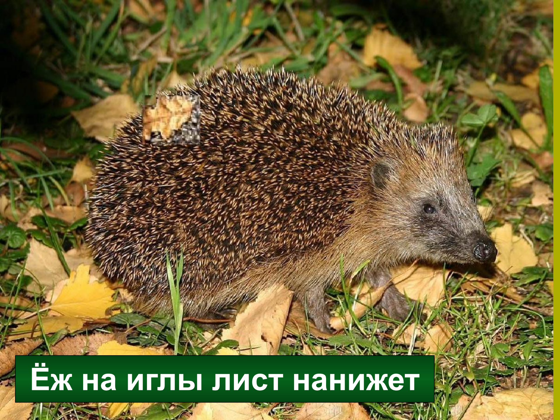
Ёж на иглы лист нанижет